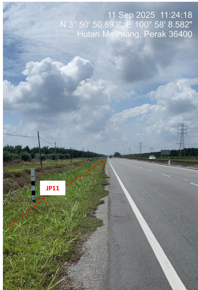
JP11 – Jln Klang Teluk Intan (Perak) HDD UG CABLE, 33kV, XLPE, AL, 1C, 630 mmp HDPE PN10 sebanyak 3x150mmdia. +1x100mmdia.