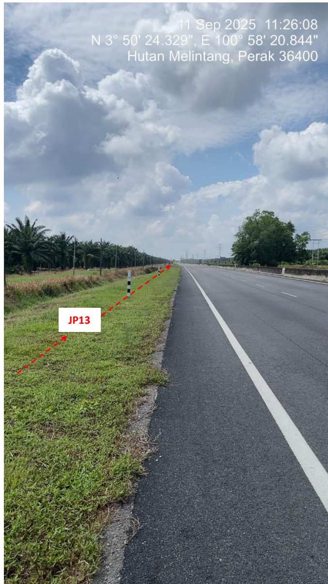
JP13 – Jln Klang Teluk Intan (Perak) HDD UG CABLE, 33kV, XLPE, AL, 1C, 630 mmp HDPE PN10 sebanyak 3x150mmdia. +1x100mmdia.