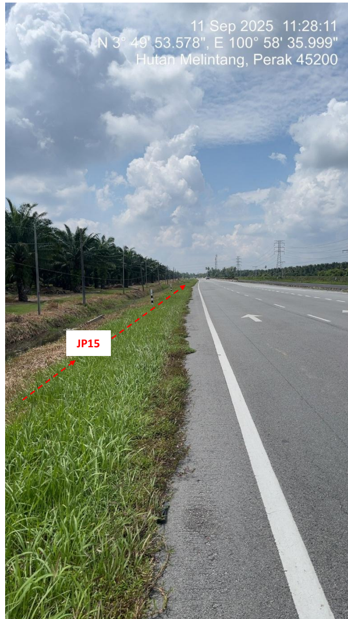
JP15 – Jln Klang Teluk Intan (Perak) HDD UG CABLE, 33kV, XLPE, AL, 1C, 630 mmp HDPE PN10 sebanyak 3x150mmdia. +1x100mmdia.