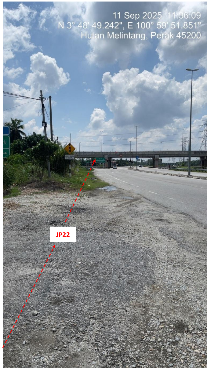
JP22 – Jln Klang Teluk Intan (Perak) HDD UG CABLE, 33kV, XLPE, AL, 1C, 630 mmp HDPE PN10 sebanyak 3x150mmdia. +1x100mmdia.