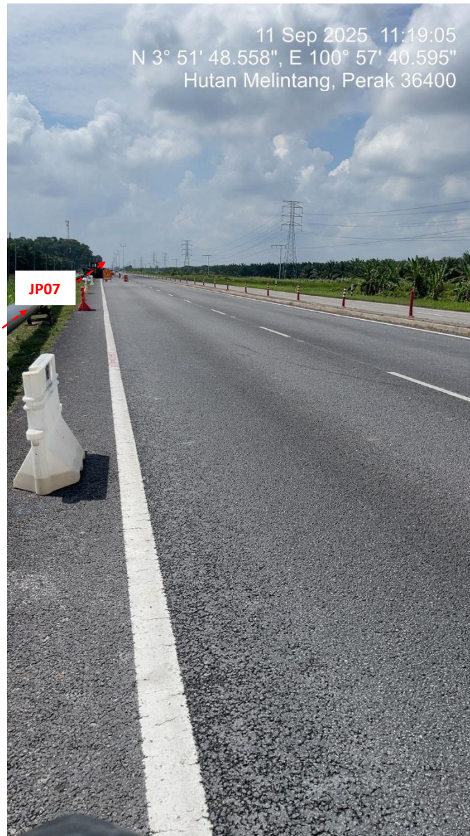
JP07 – Jln Klang Teluk Intan (Perak) HDD UG CABLE, 33kV, XLPE, AL, 1C, 630 mmp HDPE PN10 sebanyak 3x150mmdia. +1x100mmdia.