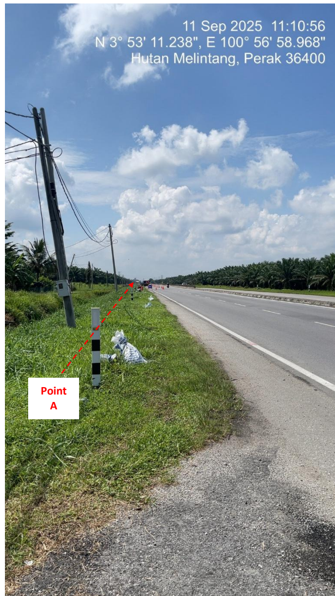
Point A (kabel dari PMU Hutan Melintang) – Jln Klang Teluk Intan (Perak) HDD UG CABLE, 33kV, XLPE, AL, 1C, 630 mmp HDPE PN10 sebanyak 3x150mmdia. +1x100mmdia.