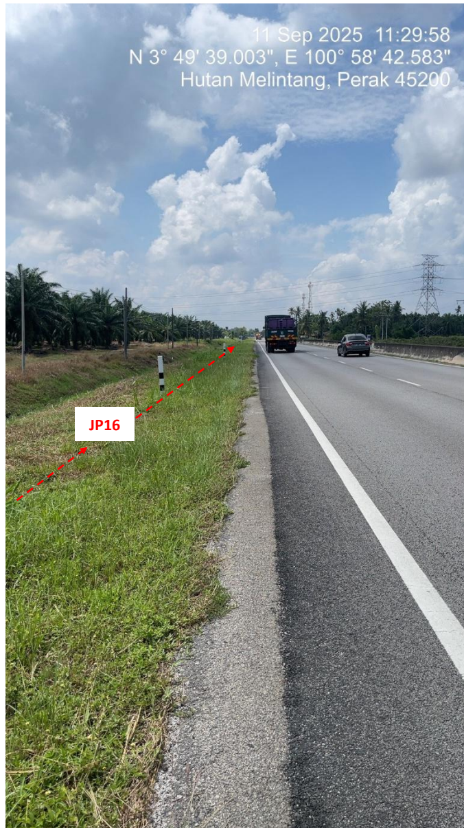
JP16 – Jln Klang Teluk Intan (Perak) HDD UG CABLE, 33kV, XLPE, AL, 1C, 630 mmp HDPE PN10 sebanyak 3x150mmdia. +1x100mmdia.