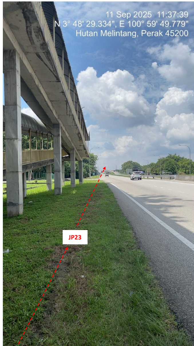
JP23 – Jln Klang Teluk Intan (Perak) HDD UG CABLE, 33kV, XLPE, AL, 1C, 630 mmp HDPE PN10 sebanyak 3x150mmdia. +1x100mmdia.