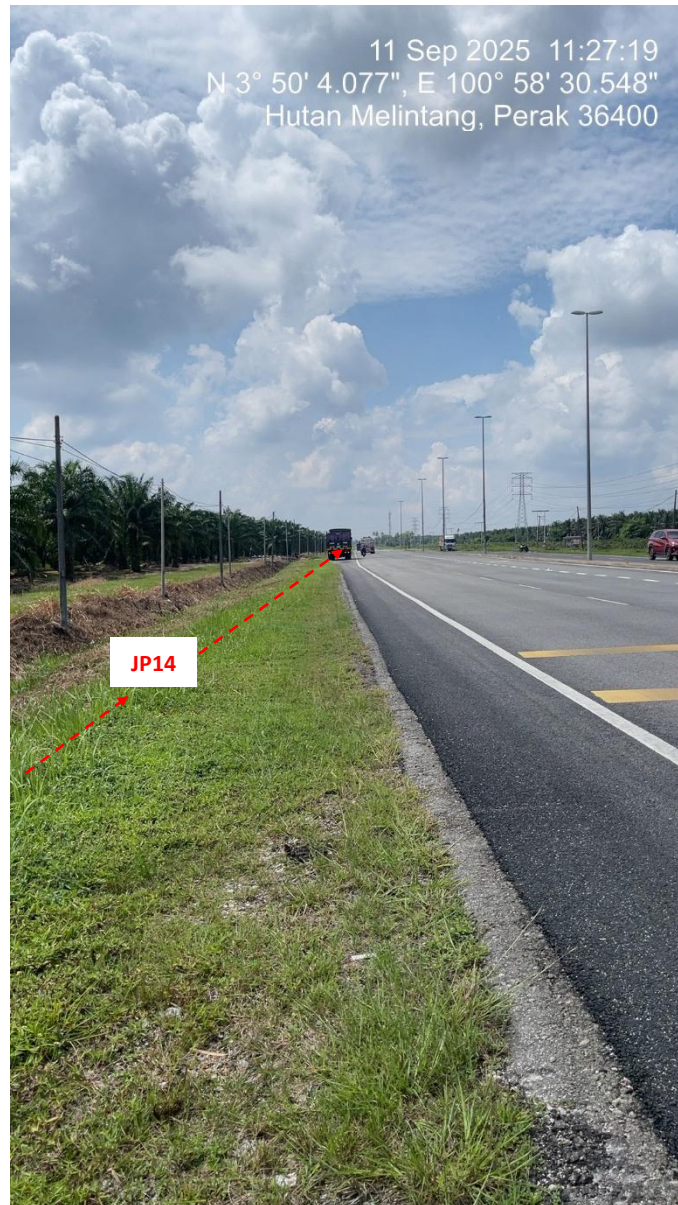
JP14 – Jln Klang Teluk Intan (Perak) HDD UG CABLE, 33kV, XLPE, AL, 1C, 630 mmp HDPE PN10 sebanyak 3x150mmdia. +1x100mmdia.