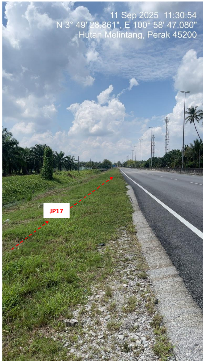
JP17 – Jln Klang Teluk Intan (Perak) HDD UG CABLE, 33kV, XLPE, AL, 1C, 630 mmp HDPE PN10 sebanyak 3x150mmdia. +1x100mmdia.