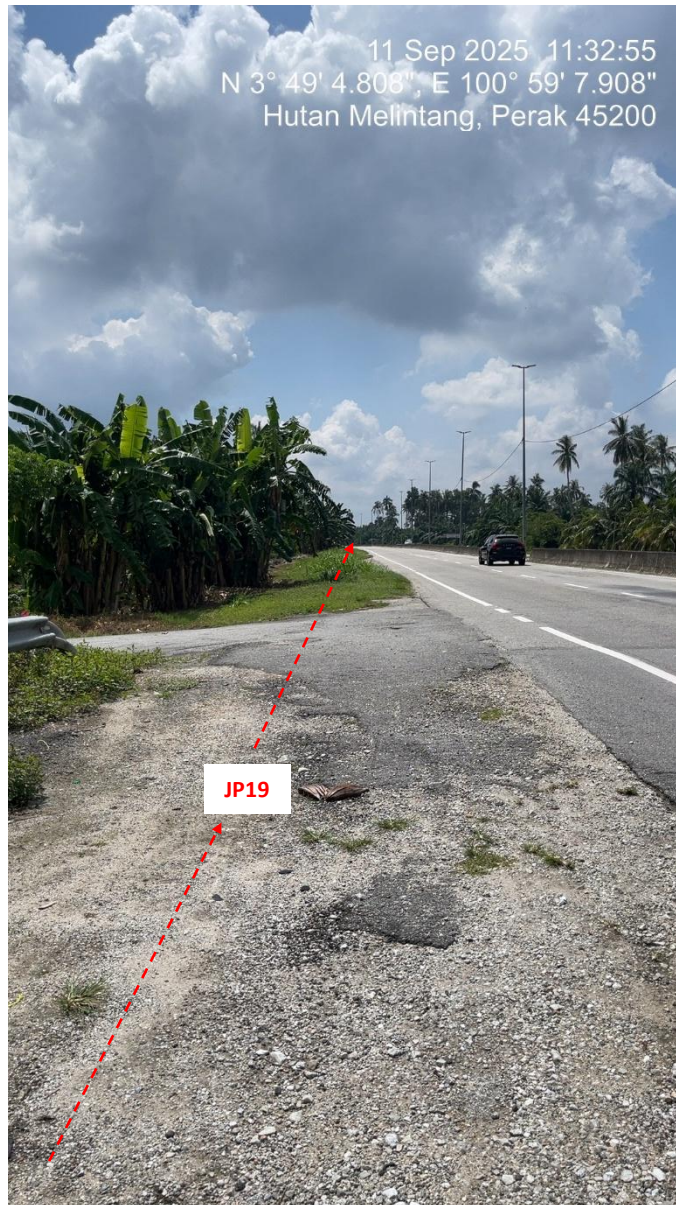
JP19 – Jln Klang Teluk Intan (Perak) HDD UG CABLE, 33kV, XLPE, AL, 1C, 630 mmp HDPE PN10 sebanyak 3x150mmdia. +1x100mmdia.