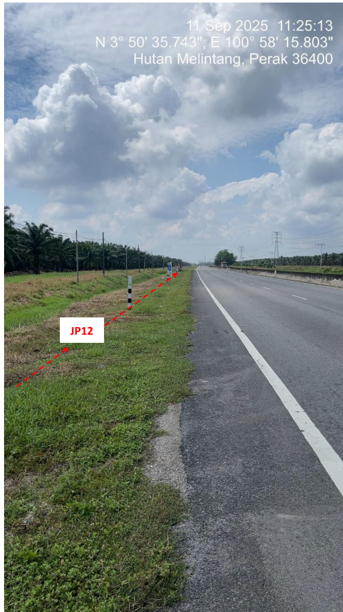
JP12 – Jln Klang Teluk Intan (Perak) HDD UG CABLE, 33kV, XLPE, AL, 1C, 630 mmp HDPE PN10 sebanyak 3x150mmdia. +1x100mmdia.