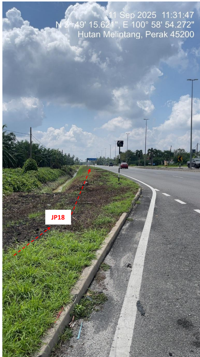
JP18 – Jln Klang Teluk Intan (Perak) HDD UG CABLE, 33kV, XLPE, AL, 1C, 630 mmp HDPE PN10 sebanyak 3x150mmdia. +1x100mmdia.