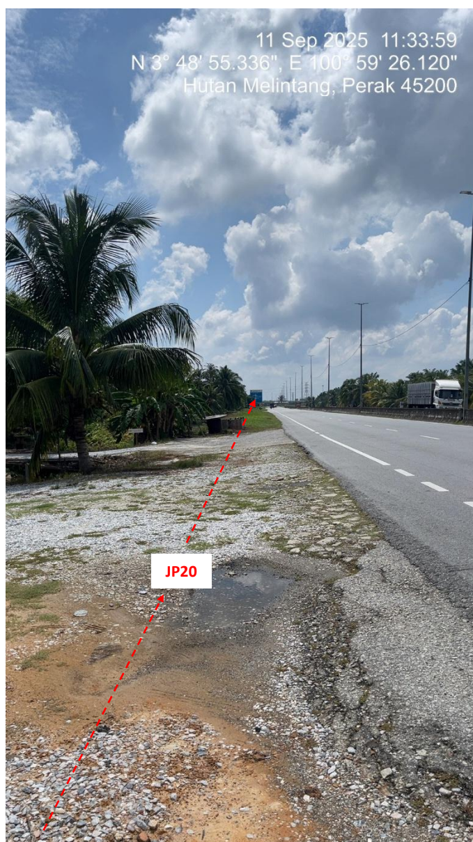
JP20 – Jln Klang Teluk Intan (Perak) HDD UG CABLE, 33kV, XLPE, AL, 1C, 630 mmp HDPE PN10 sebanyak 3x150mmdia. +1x100mmdia.