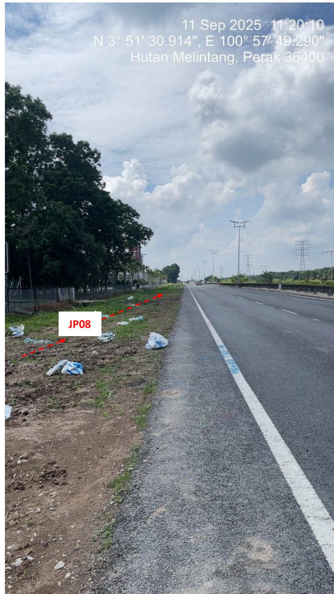
JP08 – Jln Klang Teluk Intan (Perak) HDD UG CABLE, 33kV, XLPE, AL, 1C, 630 mmp HDPE PN10 sebanyak 3x150mmdia. +1x100mmdia.