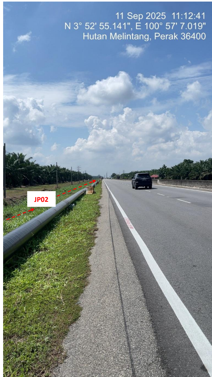
JP02 – Jln Klang Teluk Intan (Perak) HDD UG CABLE, 33kV, XLPE, AL, 1C, 630 mmp HDPE PN10 sebanyak 3x150mmdia. +1x100mmdia.

11 Sep 2025 11:12:41 N 3° 52' 55.141", E 100° 57' 7.019" Hutan Melintang, Perak 36400