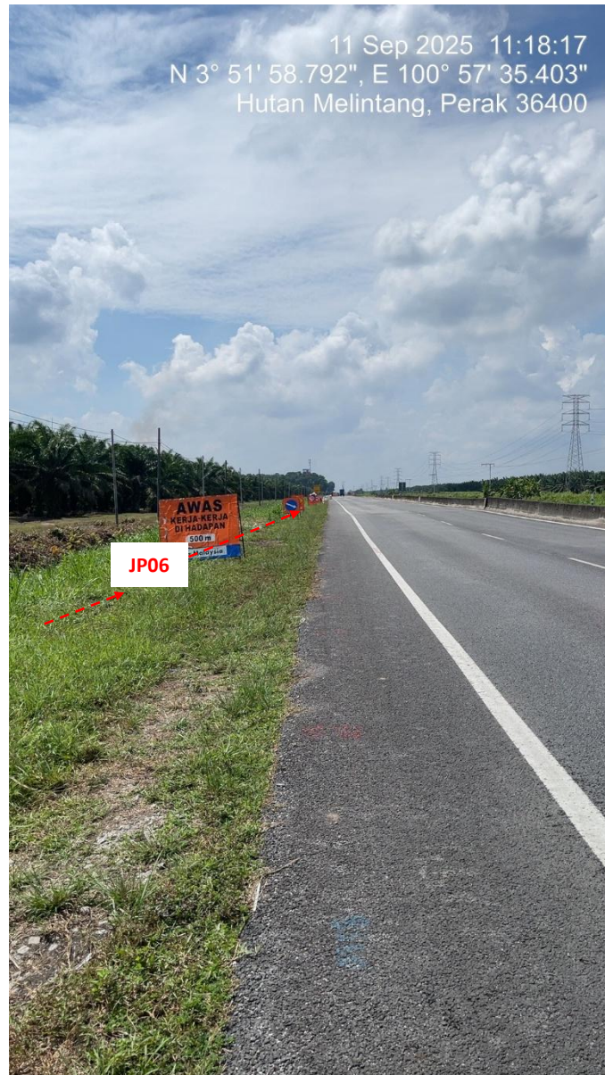
JP06 – Jln Klang Teluk Intan (Perak) HDD UG CABLE, 33kV, XLPE, AL, 1C, 630 mmp HDPE PN10 sebanyak 3x150mmdia. +1x100mmdia.