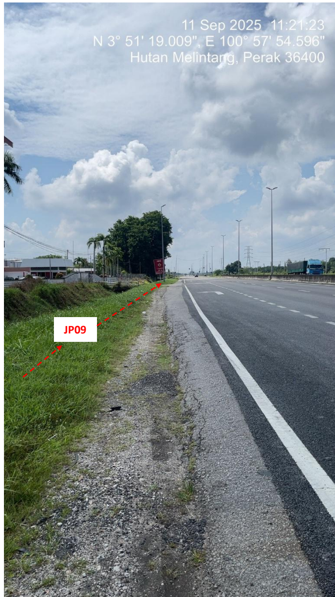
JP09 – Jln Klang Teluk Intan (Perak) HDD UG CABLE, 33kV, XLPE, AL, 1C, 630 mmp HDPE PN10 sebanyak 3x150mmdia. +1x100mmdia.