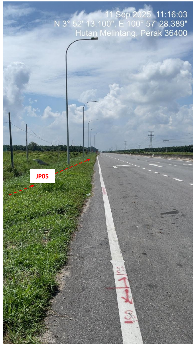
JP05 – Jln Klang Teluk Intan (Perak) HDD UG CABLE, 33kV, XLPE, AL, 1C, 630 mmp HDPE PN10 sebanyak 3x150mmdia. +1x100mmdia.