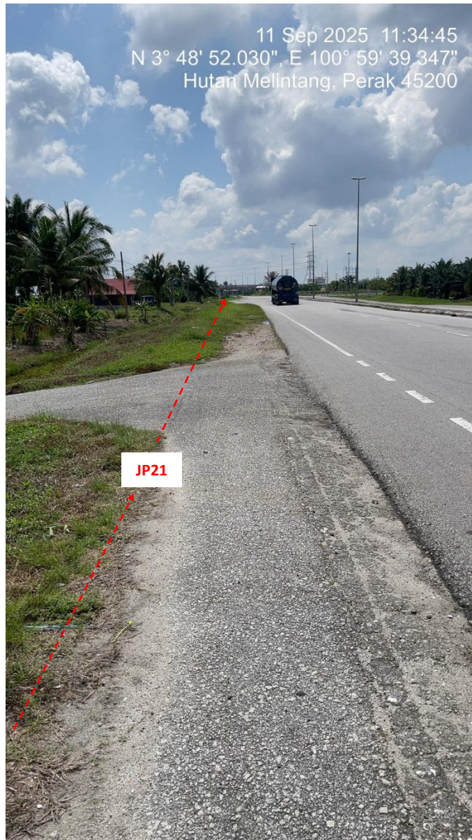
JP21 – Jln Klang Teluk Intan (Perak) HDD UG CABLE, 33kV, XLPE, AL, 1C, 630 mmp HDPE PN10 sebanyak 3x150mmdia. +1x100mmdia.