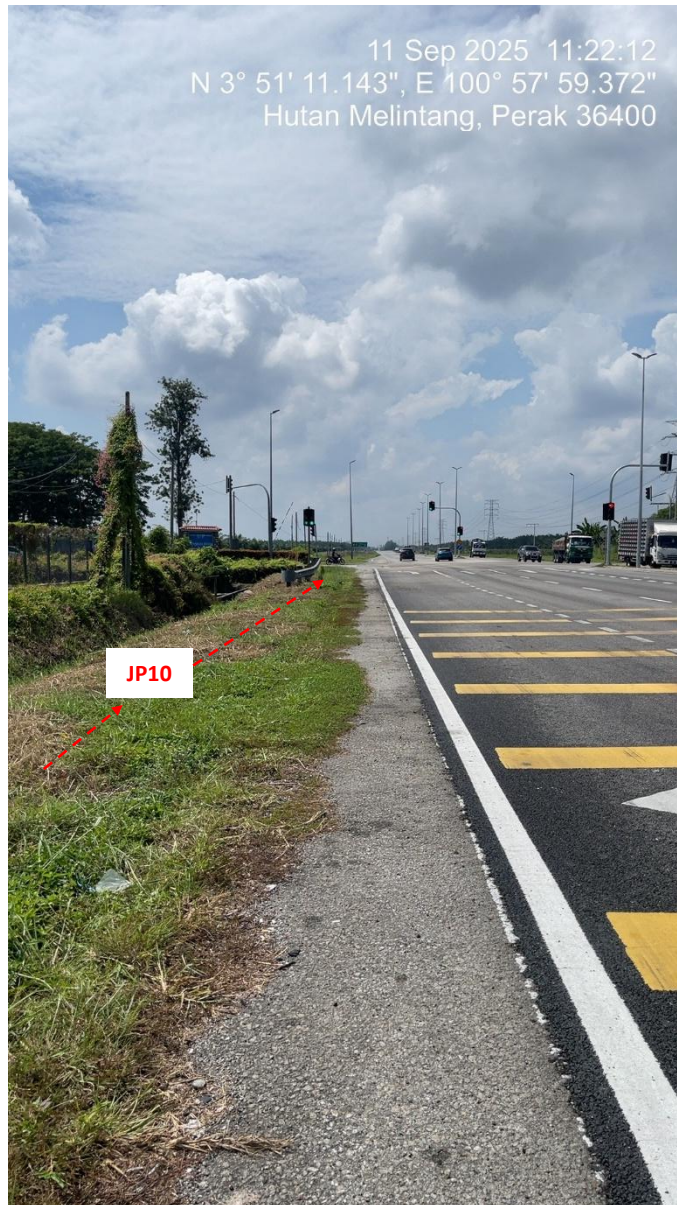
JP10 – Jln Klang Teluk Intan (Perak) HDD UG CABLE, 33kV, XLPE, AL, 1C, 630 mmp HDPE PN10 sebanyak 3x150mmdia. +1x100mmdia.