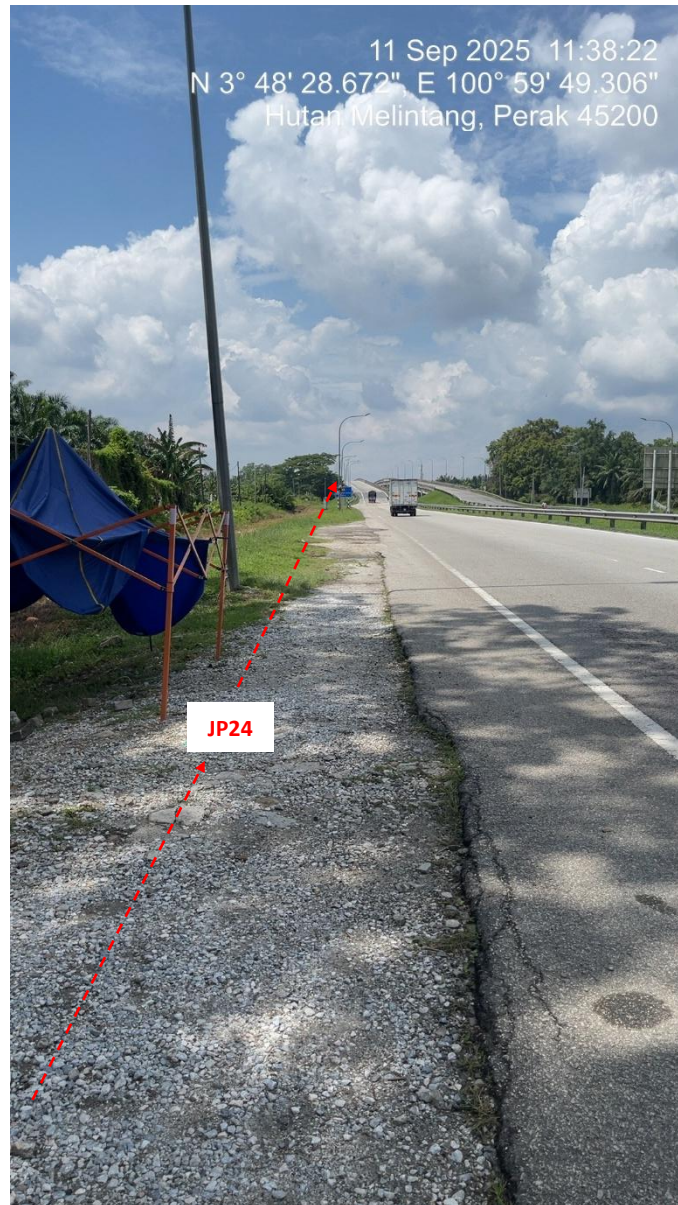
Point B (Kabel merentasi sungai ke Sabak Bernam) – Jln Klang Teluk Intan (Perak) HDD UG CABLE, 33kV, XLPE, AL, 1C, 630 mmp HDPE PN10 sebanyak 3x150mmdia. +1x100mmdia.