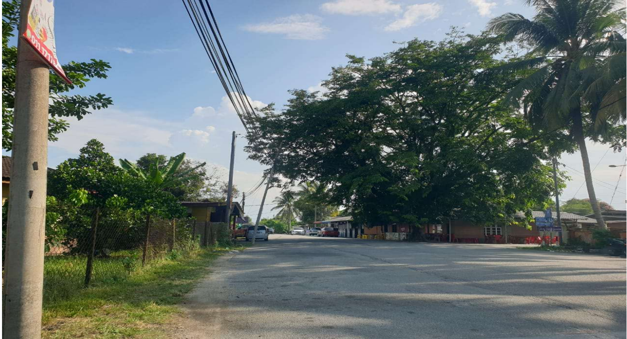
GAMBAR 1: KG PASU TIGA (PERMULAAN)