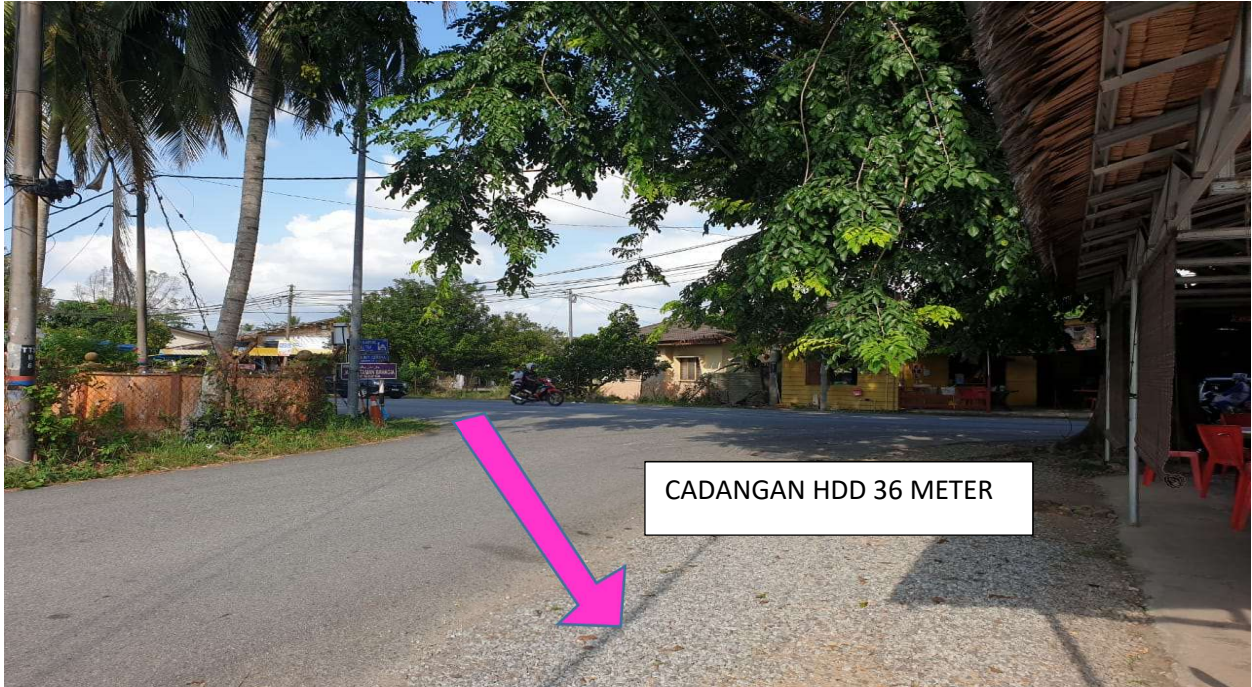
GAMBAR 2: KAWASAN KERJA MELIBATKAN 'HORIZONTAL DIRECTIONAL DRILLING' (HDD)