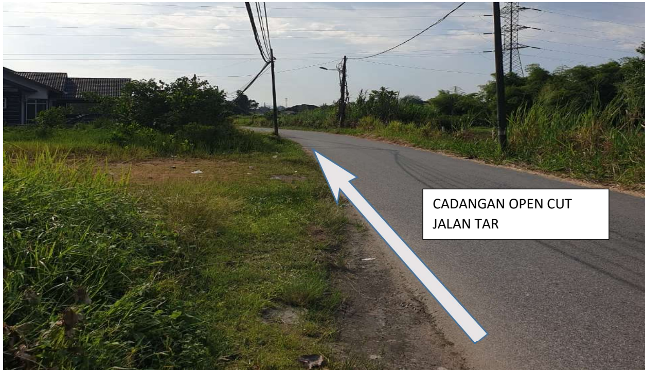
GAMBAR 5: KAWASAN KERJA MELIBATKAN OPEN CUT JALAN TAR.