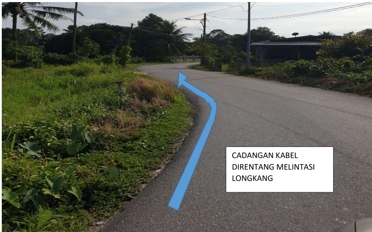
GAMBAR 6: KAWASAN MELIBATKAN MELINTASI LONGKANG.