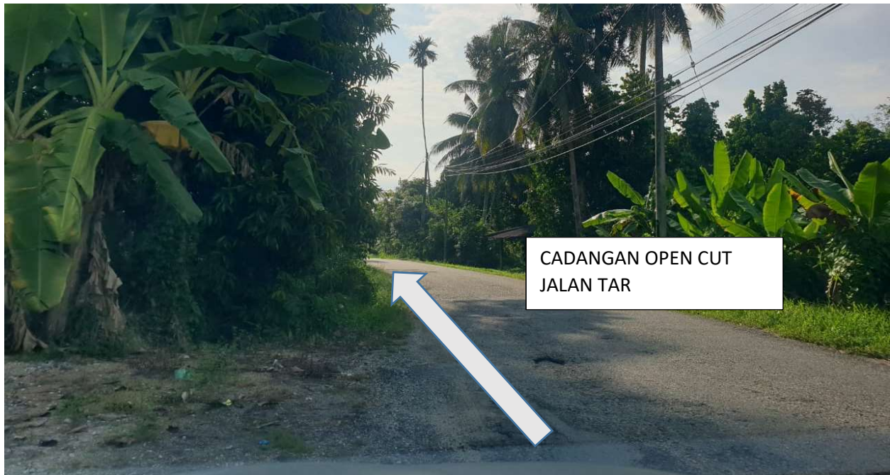
GAMBAR 10: KAWASAN KERJA MELIBATKAN JALAN TAR