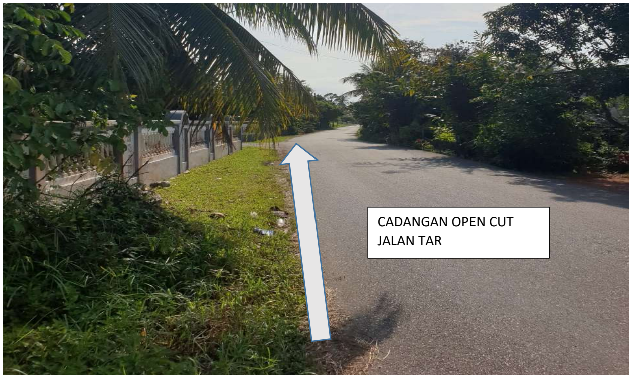
GAMBAR 7: KAWASAN KERJA MELIBATKAN JALAN TAR