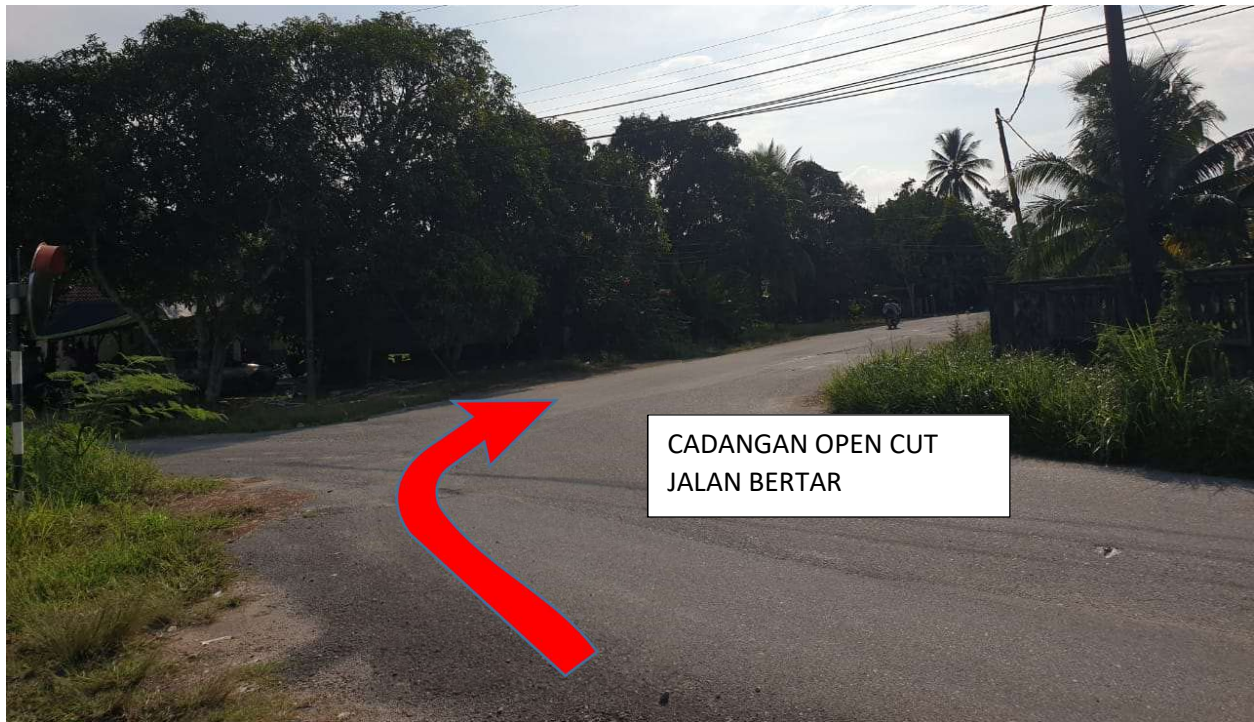
GAMABR 9: KAWASAN KERJA MELIBATKAN JALAN BERTAR.