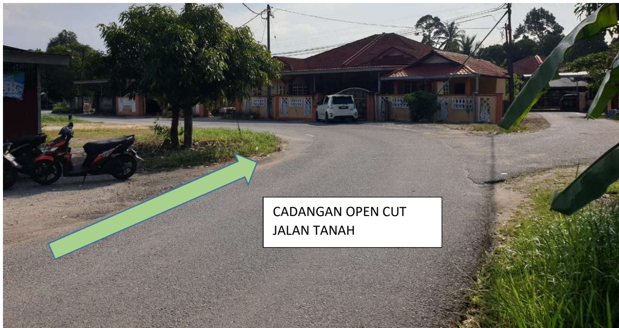
GAMBAR 8: KAWASAN KERJA MELIBATKAN JALAN TANAH.