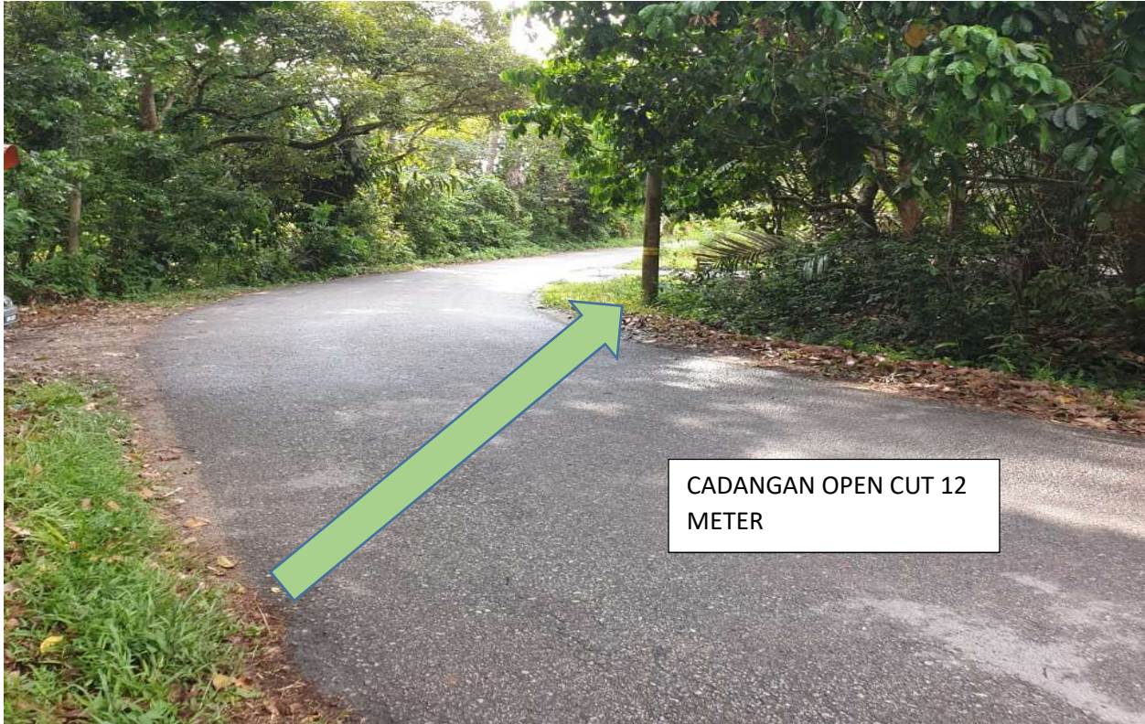
GAMBAR 13: KAWASAN KERJA MELIBATKAN OPEN CUT JALAN TAR