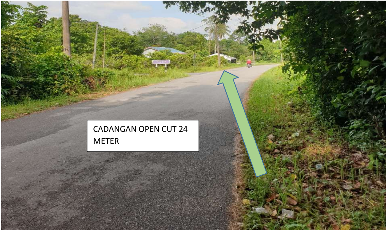
GAMBAR 14: KAWASAN KERJA MELIBATKAN OPEN CUT JALAN TAR