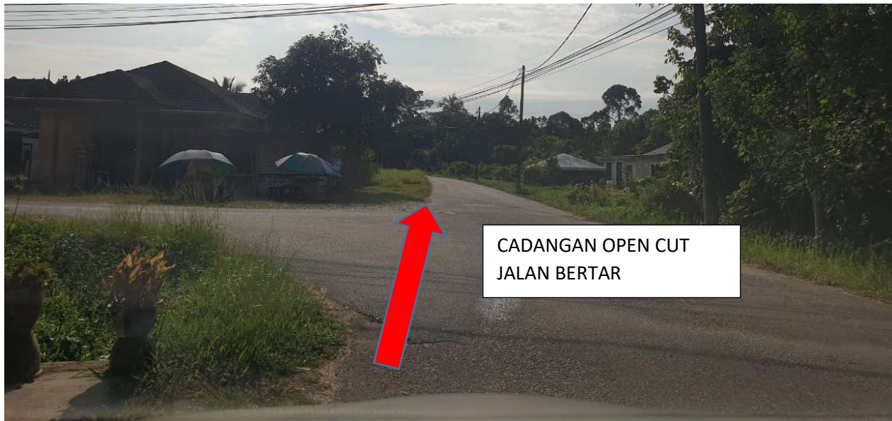
GAMBAR 11: KAWASAN KERJA MELIBATKAN JALAN BERTAR.