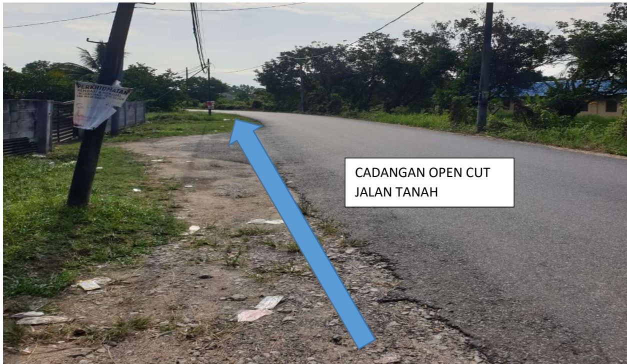
GAMBAR 3: KAWASAN KABEL DIRENTANG PADA JALAN TANAH.