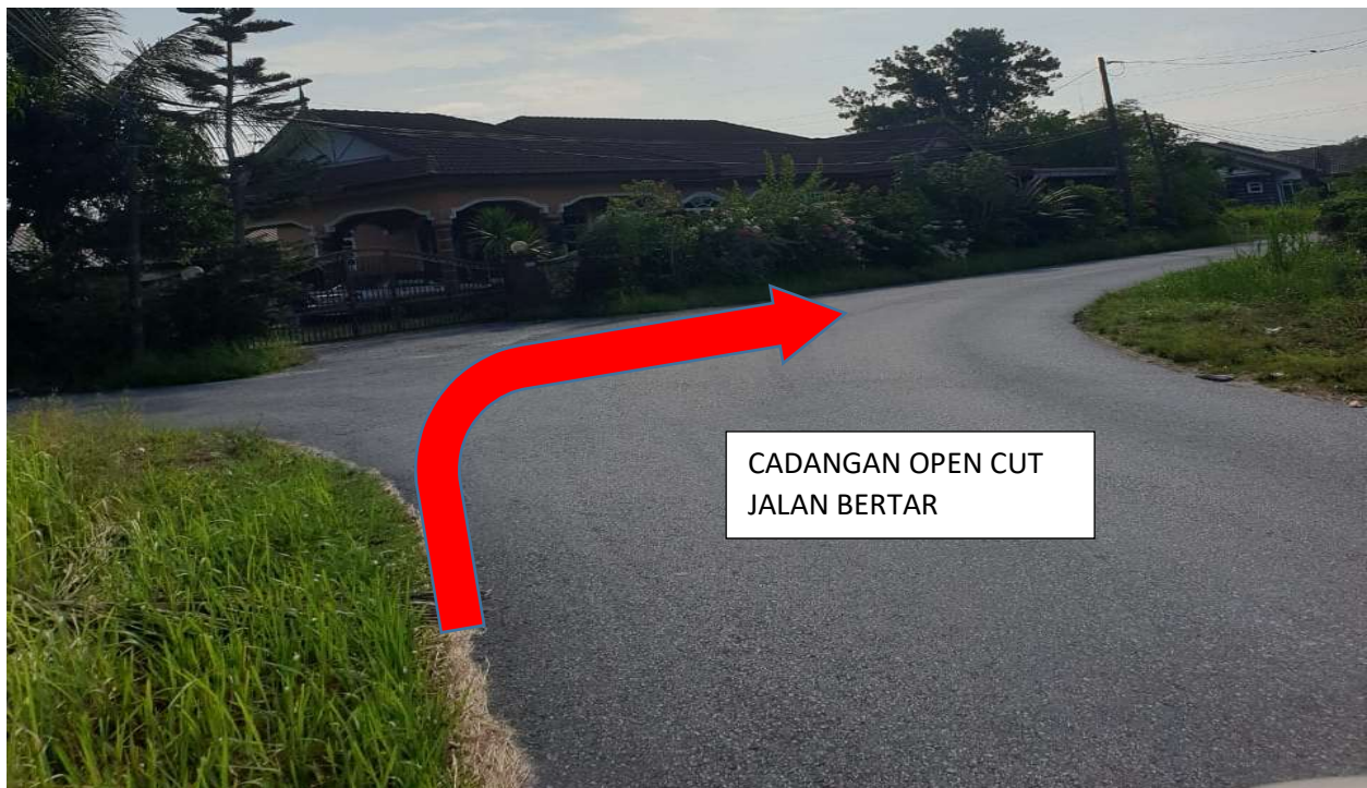
GAMBAR 4: KAWASAN KERJA MELIBATKAN OPEN CUT JALAN BERTAR