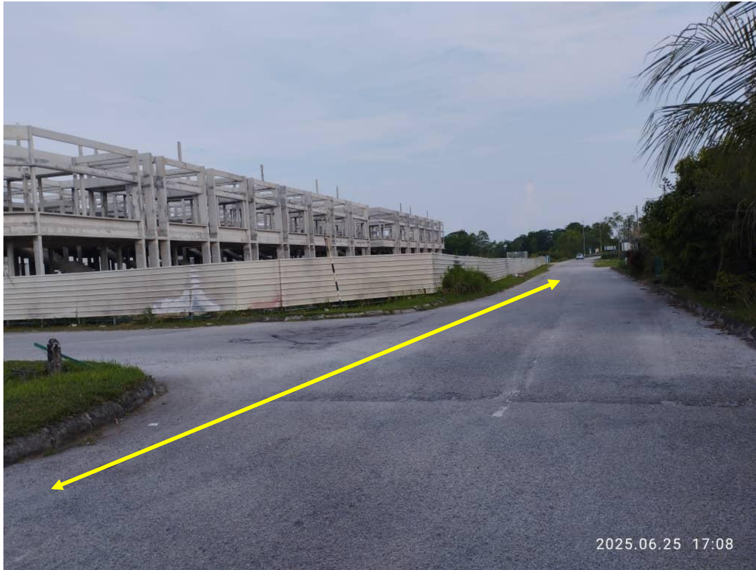
Proposed open cut for TNB works at Persiaran Bandar Tasik Idaman