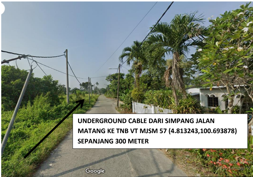
GAMBAR 3 : KAWASAN KERJA UNTUK PENGALIHAN TIANG DAN TALIAN MELIBATKAN LALUAN REZAB JALAN JKR