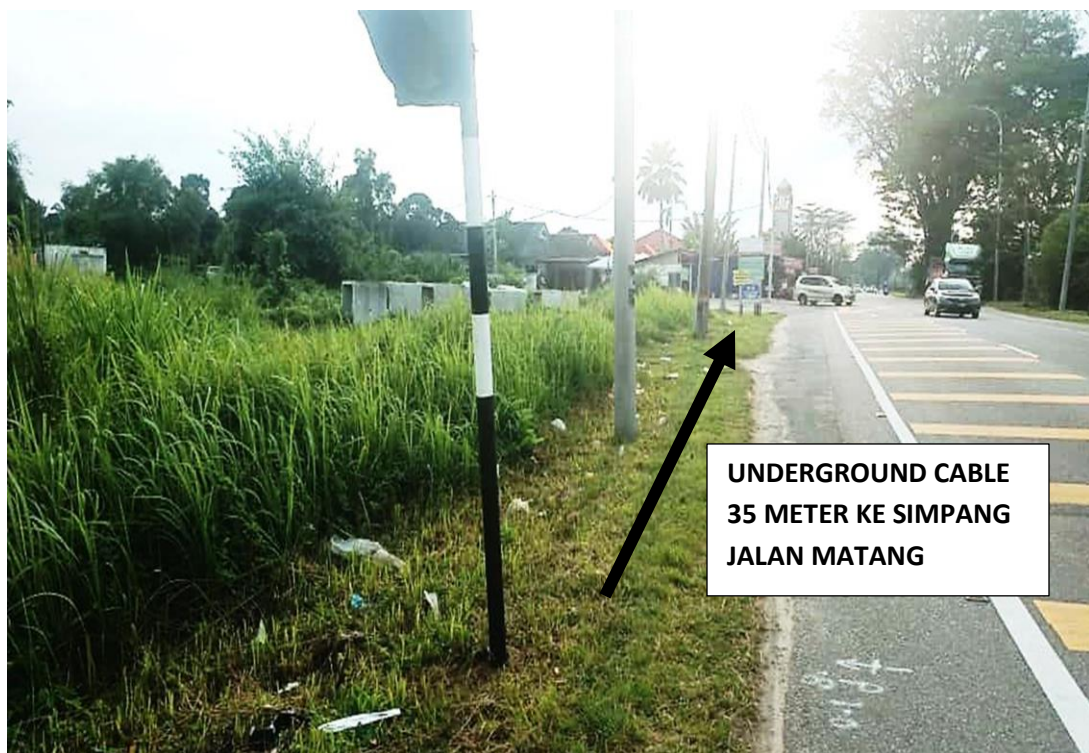
GAMBAR 2 : KAWASAN KERJA UNTUK PENGALIHAN TIANG DAN TALIAN MELIBATKAN LALUAN REZAB JALAN JKR