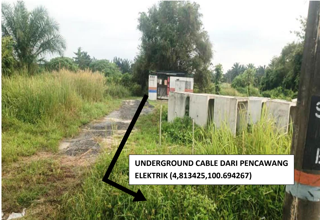
GAMBAR 1 : PENCAWANG SEDIA ADA