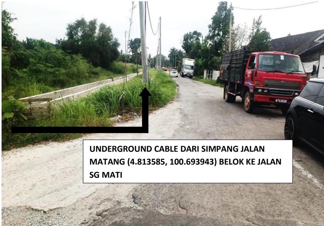
GAMBAR 3 : KAWASAN KERJA UNTUK PENGALIHAN TIANG DAN TALIAN MELIBATKAN LALUAN REZAB JALAN JKR