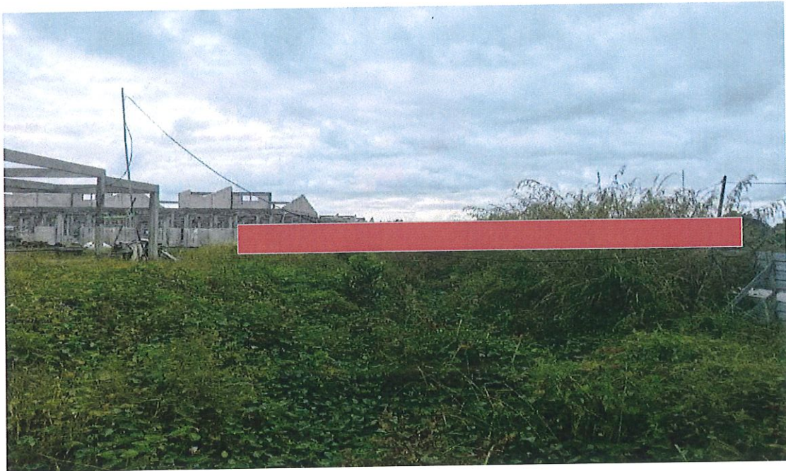
KAWASAN KERJA MELIBATKAN KAEDAH HORIZONTAL DIRECT DRILING (HDD)