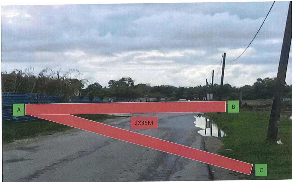
KAWASAN KERJA MELIBATKAN KAEDAH HORIZONTAL DIRECT DRILING (HDD)