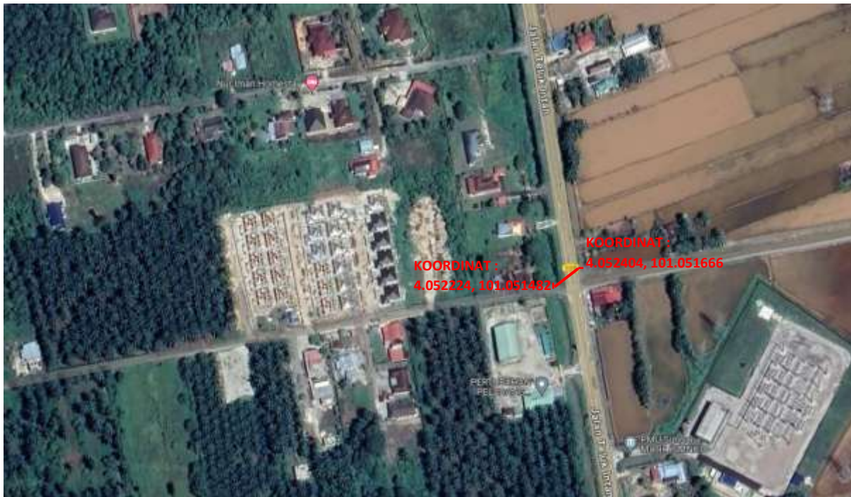
Cadangan HDD 2 Paip 40 meter