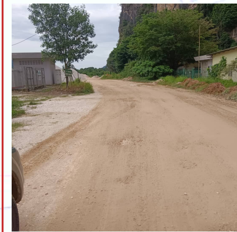
SIMPANAN JALAN SEDIADA IALAH JALAN TANAH

SIMPANAN JALAN YANG DIPOHON UNTUK IZINLALU