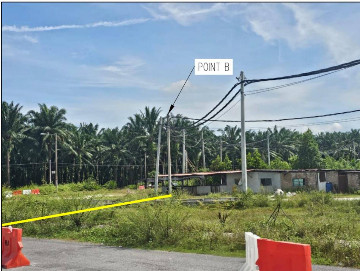
RAJAH 3: POINT B – TIANG "POLE TNB CT37" (RUJUK RAJAH 1)