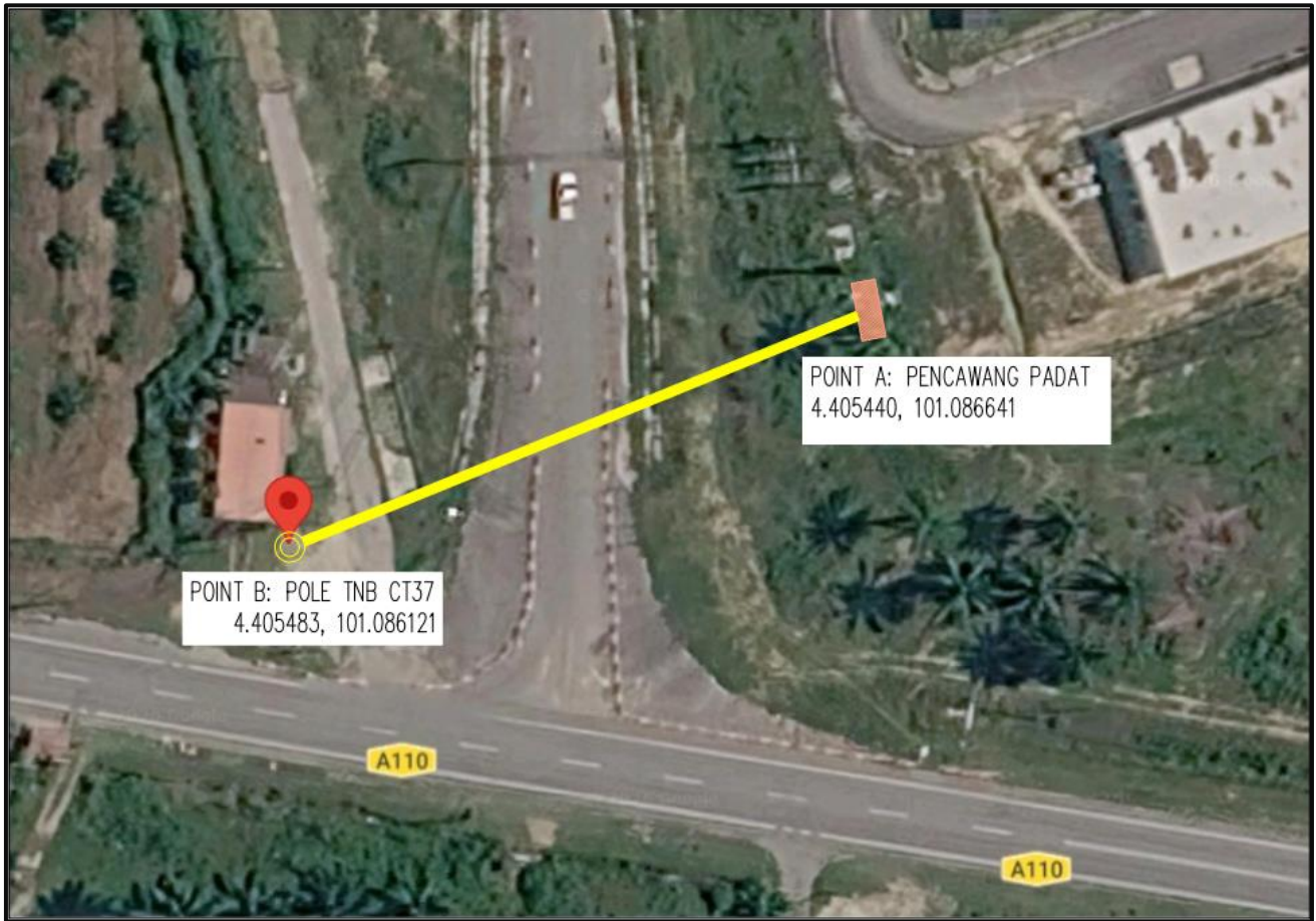
RAJAH 1: PELAN LALUAN KABEL ELEKTRIK 11kV