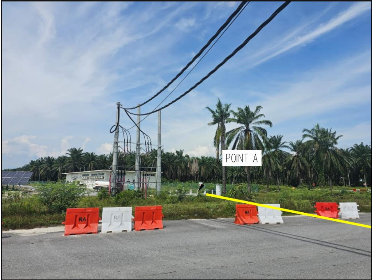
RAJAH 2: POINT A - LALUAN KABEL ELEKTRIK DARI TIANG "POLE" TNB CT 37 (RUJUK RAJAH 1)