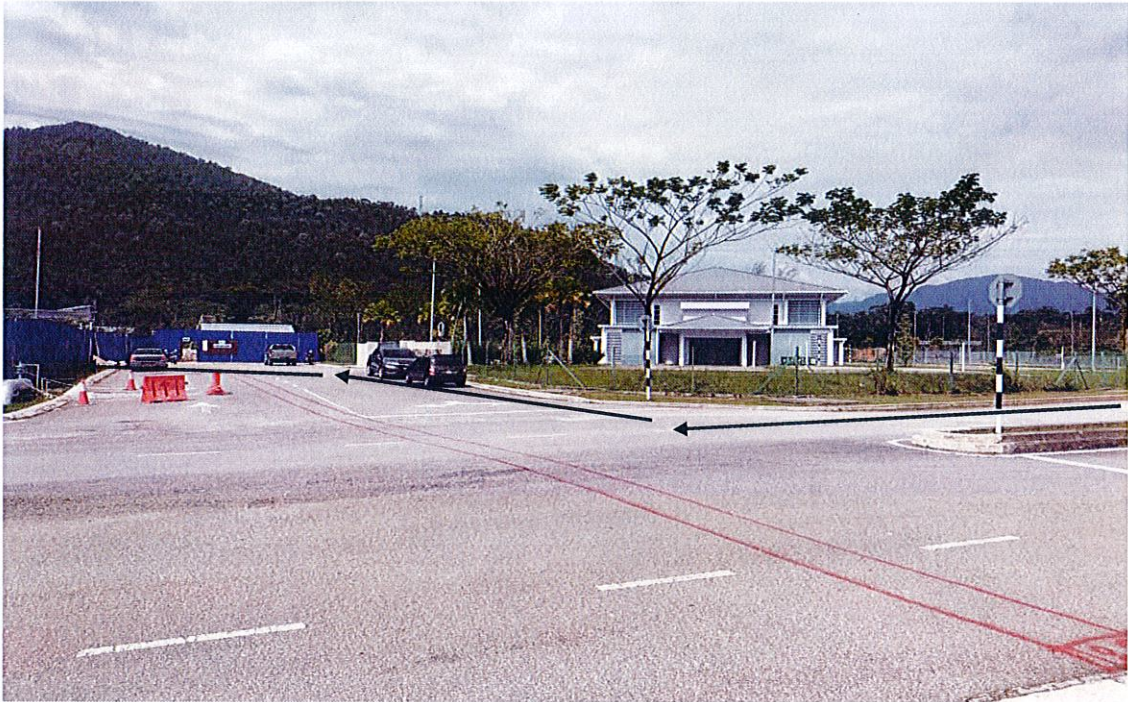
4- Kawasan tapak perumahan IRIZ bagi permohonan bekalan elektrik baru.