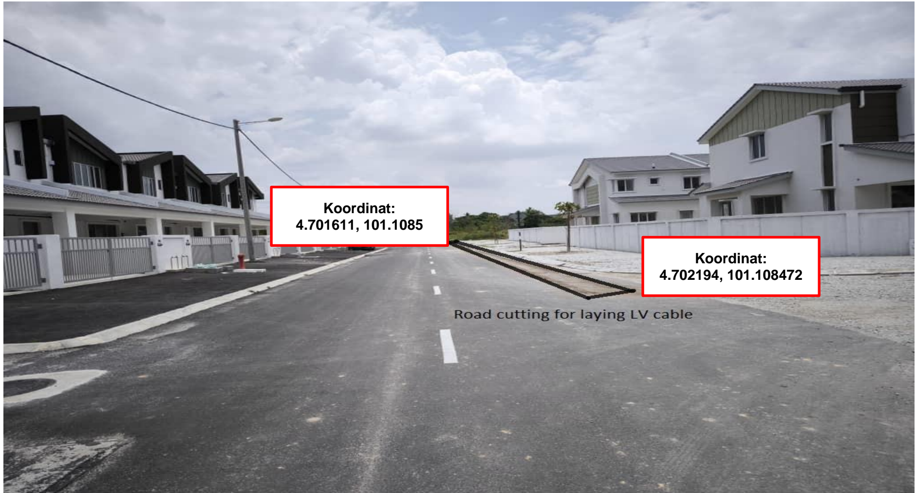
Gambar 2: Kawasan Kerja Melibatkan Pengorekan Jalan