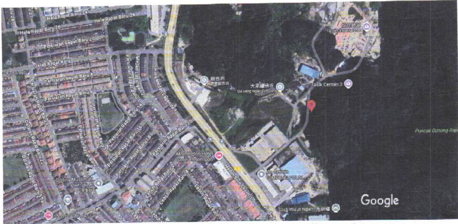
圖像 © 2025 Airbus、CNES / Airbus、Maxar Technologies、地圖資料 ©2025 Google 100 公尺