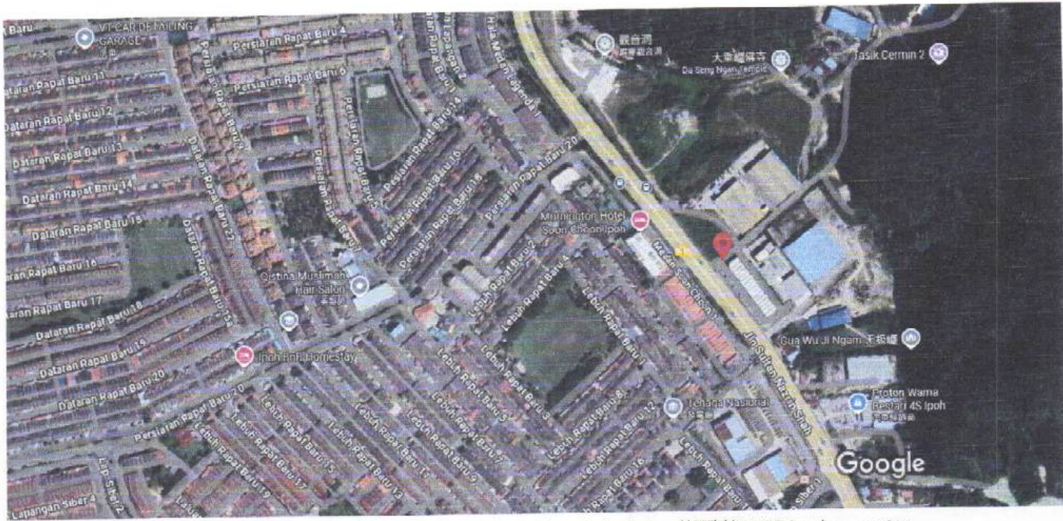
圖像 © 2025 Airbus、CNES / Airbus、Maxar Technologies、地圖資料 ©2025 Google 100 公尺