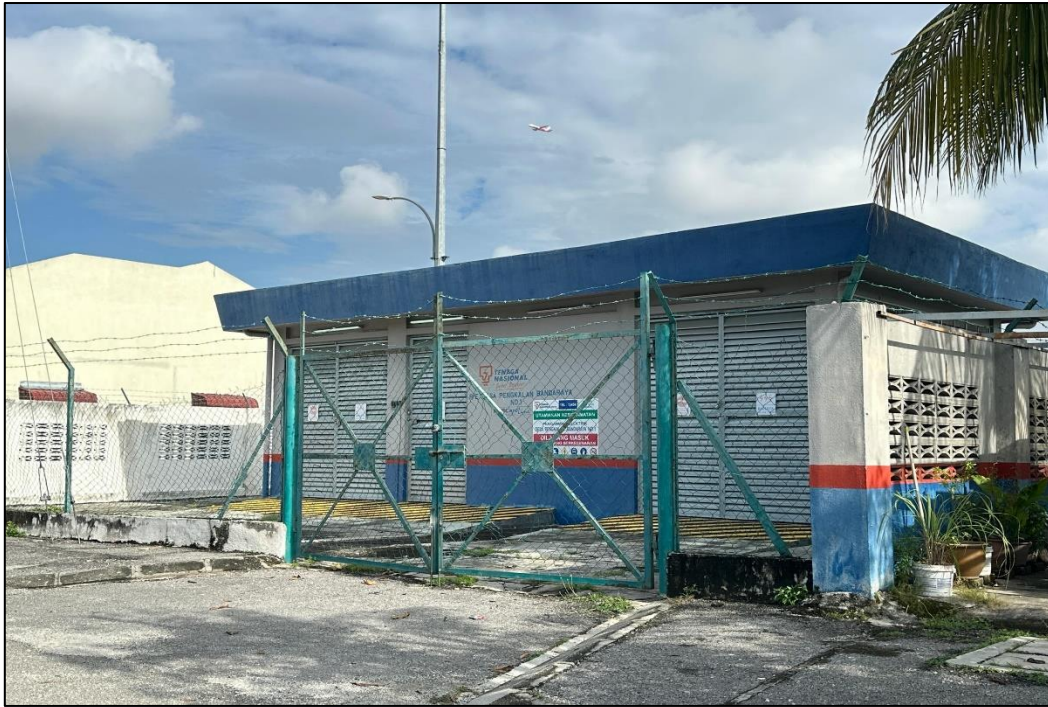
GAMBAR 1: PENCAWANG SEDIA ADA (PENCAWANG DESA PENGKALAN BANDARAYA NO.1)