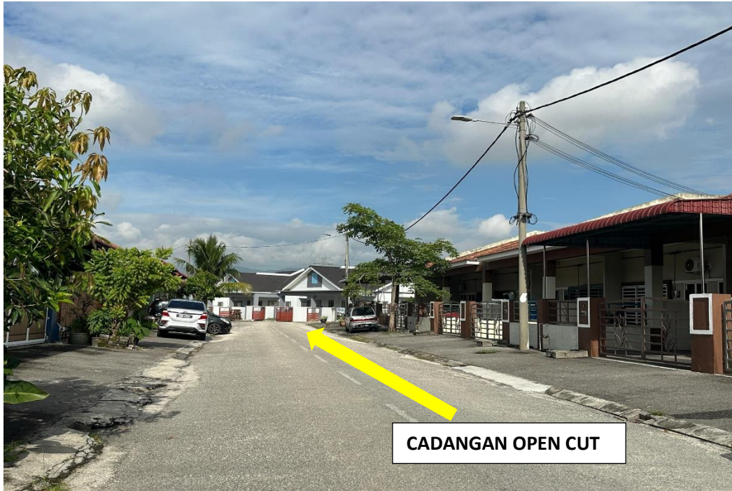
GAMBAR 3: KAWASAN KERJA MELIBATKAN OPEN CUT (PENGKALAN BANDARAYA 2)