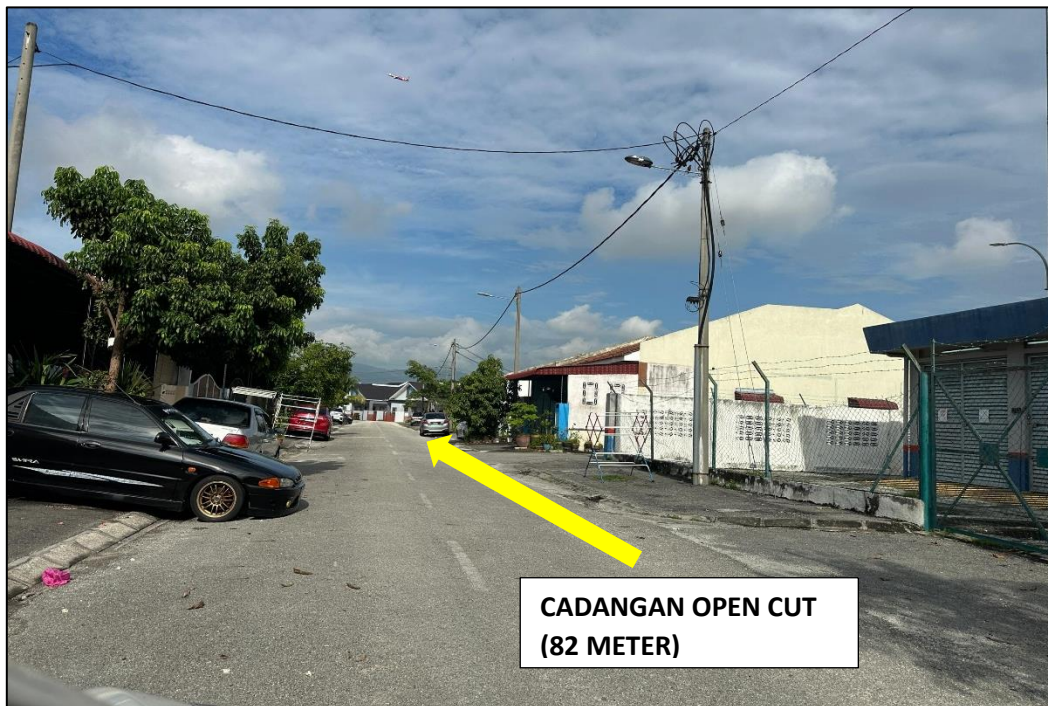
GAMBAR 2: KAWASAN KERJA MELIBATKAN OPEN CUT (PENGKALAN BANDARAYA 2)