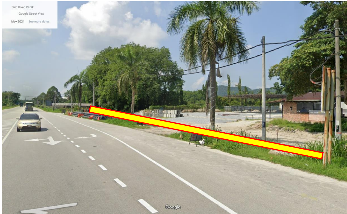
Gambar 1 : Cadangan Laluan Kabel Secara 'Open-cut' di kawasan rezab jalan susur/khidmat 50' sepanjang 60m