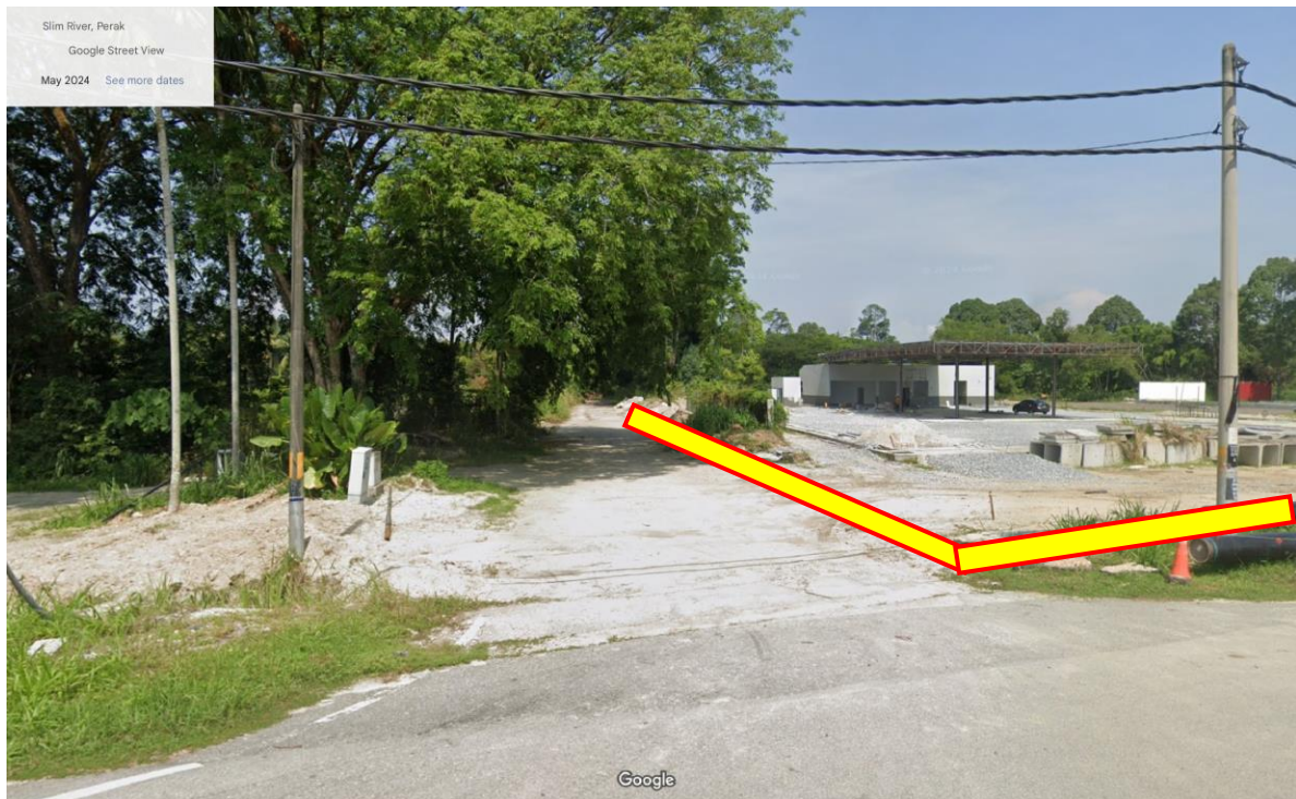
Gambar 2 : Cadangan Laluan Kabel Secara 'Open-cut' di kawasan rezab jalan susur 40' masuk ke tapak pencawang padat sepanjang 86m.