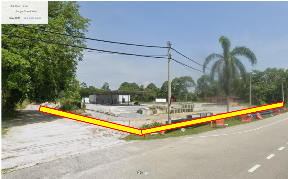
Gambar 3 : Cadangan Laluan Kabel Secara 'Open-cut' di kawasan rezab jalan susur/khidmat 50' dan jalan susur 40' ke tapak pencawang padat dengan jarak keseluruhan 146m.