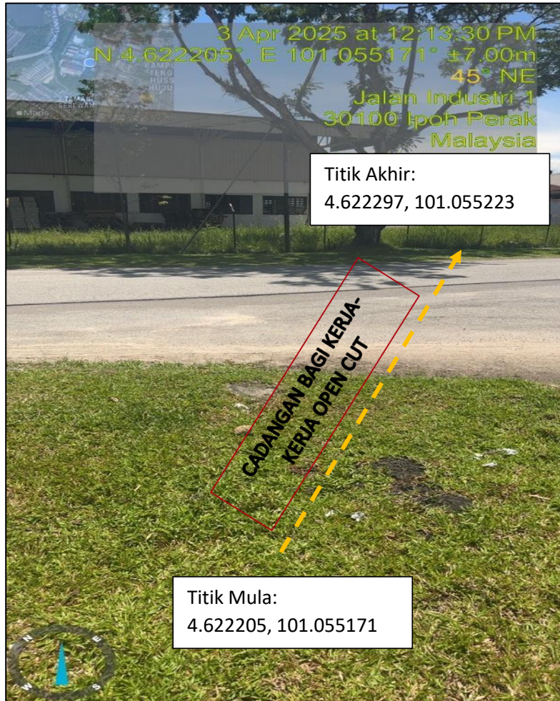
GAMBAR 1 : TITIK MULA LOKASI BAGI MELAKUKAN KERJA-KERJA KOREKKAN OPEN CUT