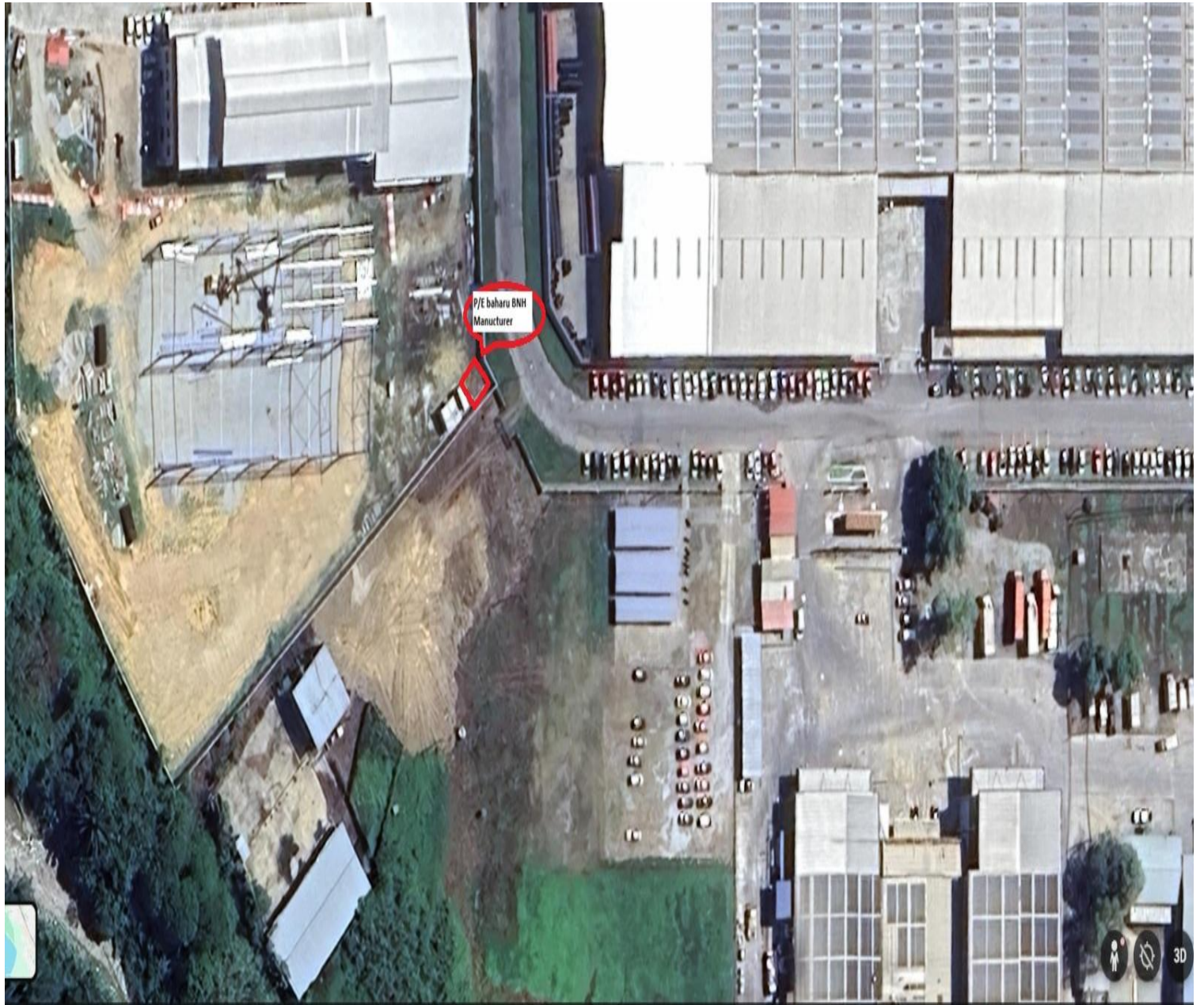
Gambar Lokasi BNH Manufacturing