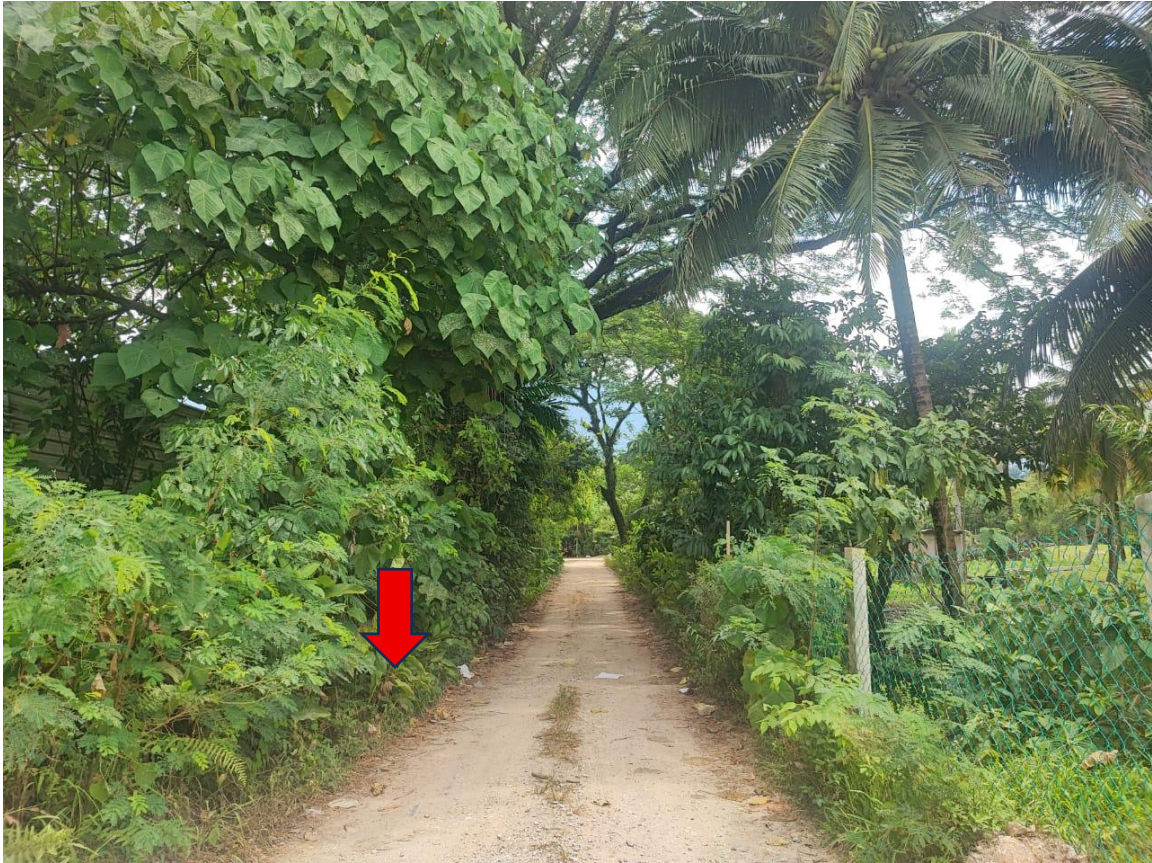
POINT 7 & POINT D