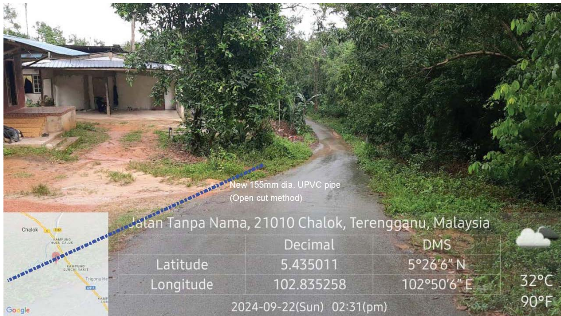
GAMBAR 6 : Kawasan cadangan laluan paip baru pada laluan tepi jalan.