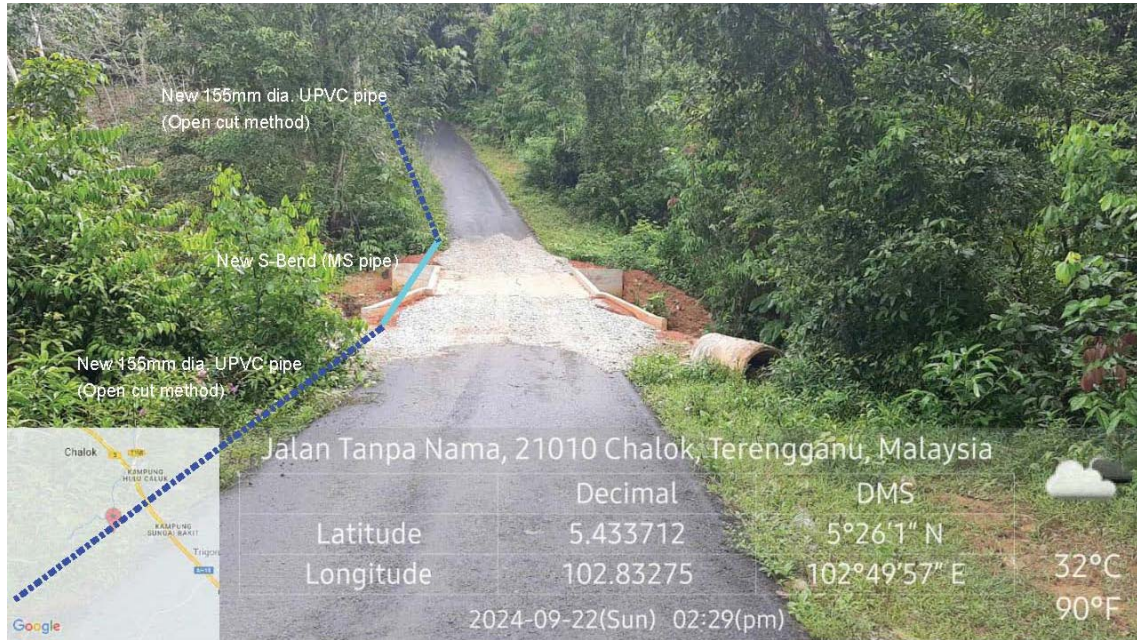
GAMBAR 5 : Kawasan cadangan laluan paip baru pada laluan tepi jalan.