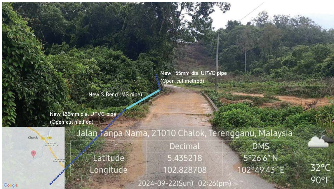
GAMBAR 2 : Kawasan cadangan laluan paip baru pada laluan tepi jalan.