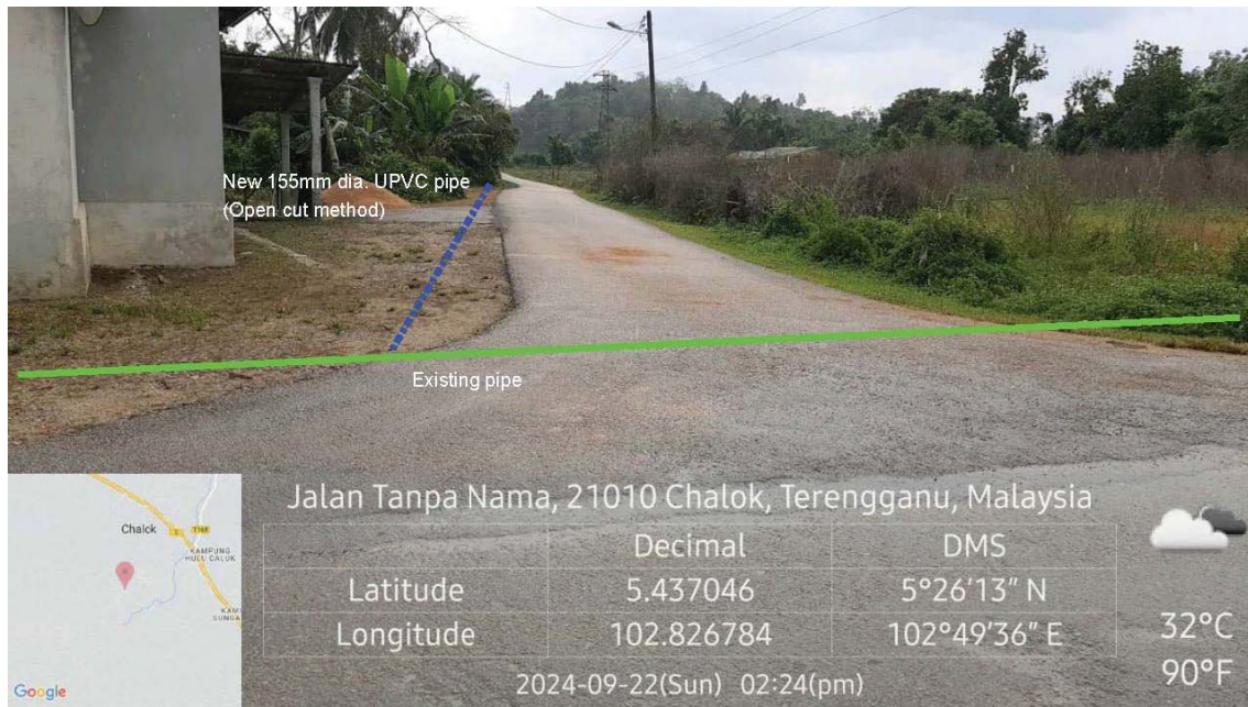
GAMBAR 1 : Kawasan cadangan laluan paip baru dan sambungan ke paip sedia ada.