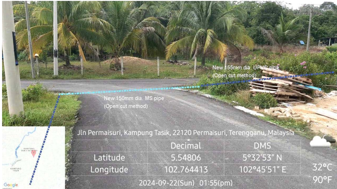
GAMBAR 3 : Kawasan cadangan laluan paip baru pada laluan tepi jalan.