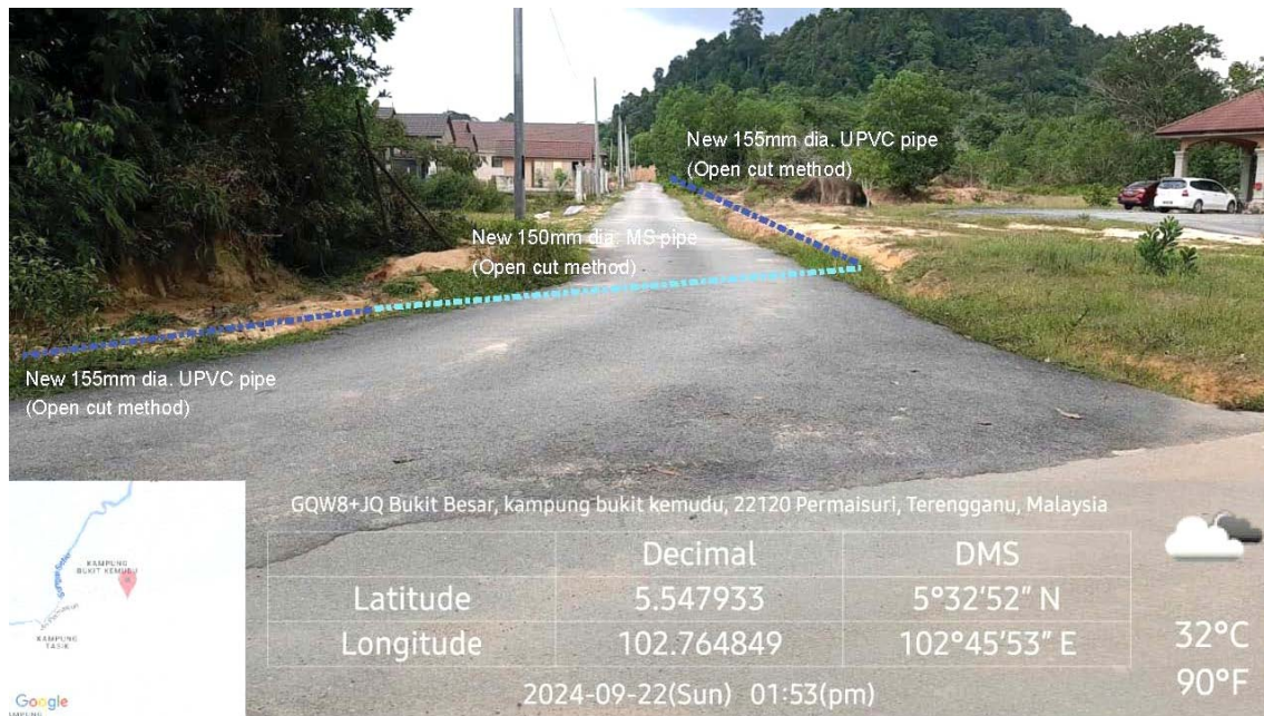
GAMBAR 2 : Kawasan cadangan laluan paip baru pada laluan tepi jalan.