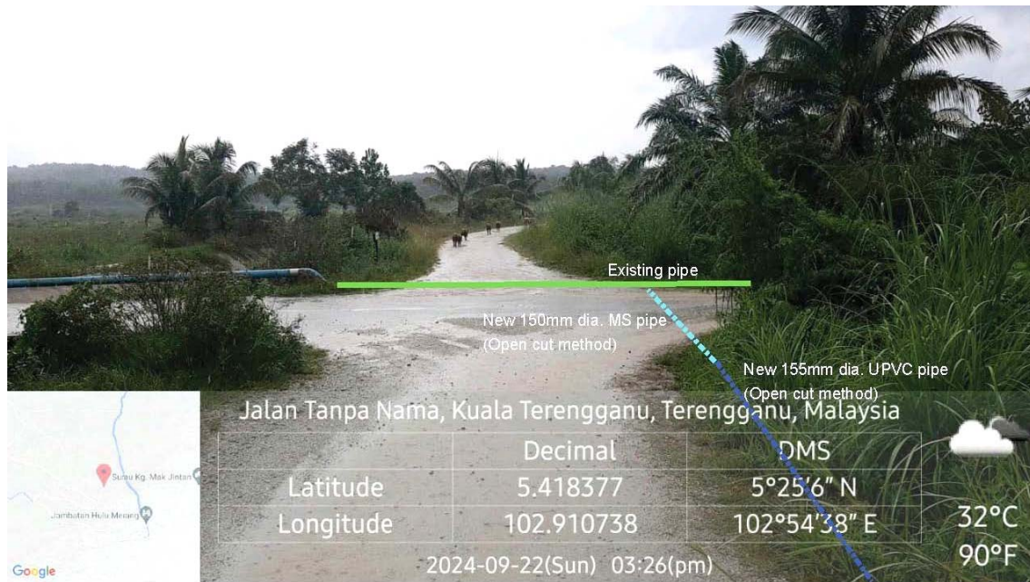
GAMBAR 4 : Kawasan cadangan laluan paip baru dan sambungan ke paip sedia ada.