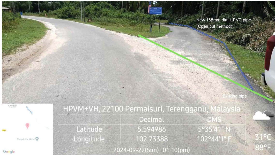
GAMBAR 1 : Kawasan cadangan laluan paip baru dan sambungan ke paip sedia ada.