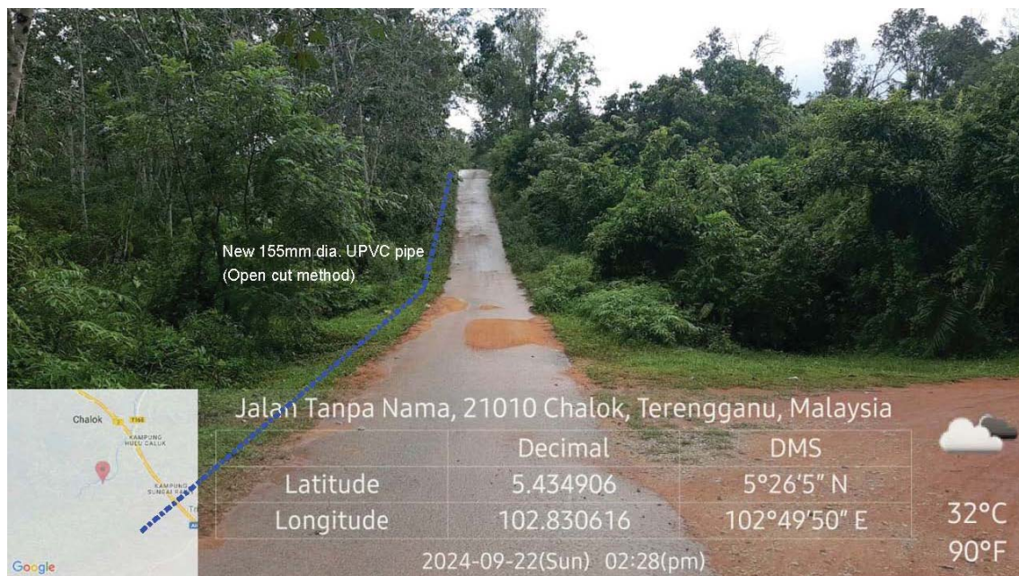
GAMBAR 4 : Kawasan cadangan laluan paip baru pada laluan tepi jalan.