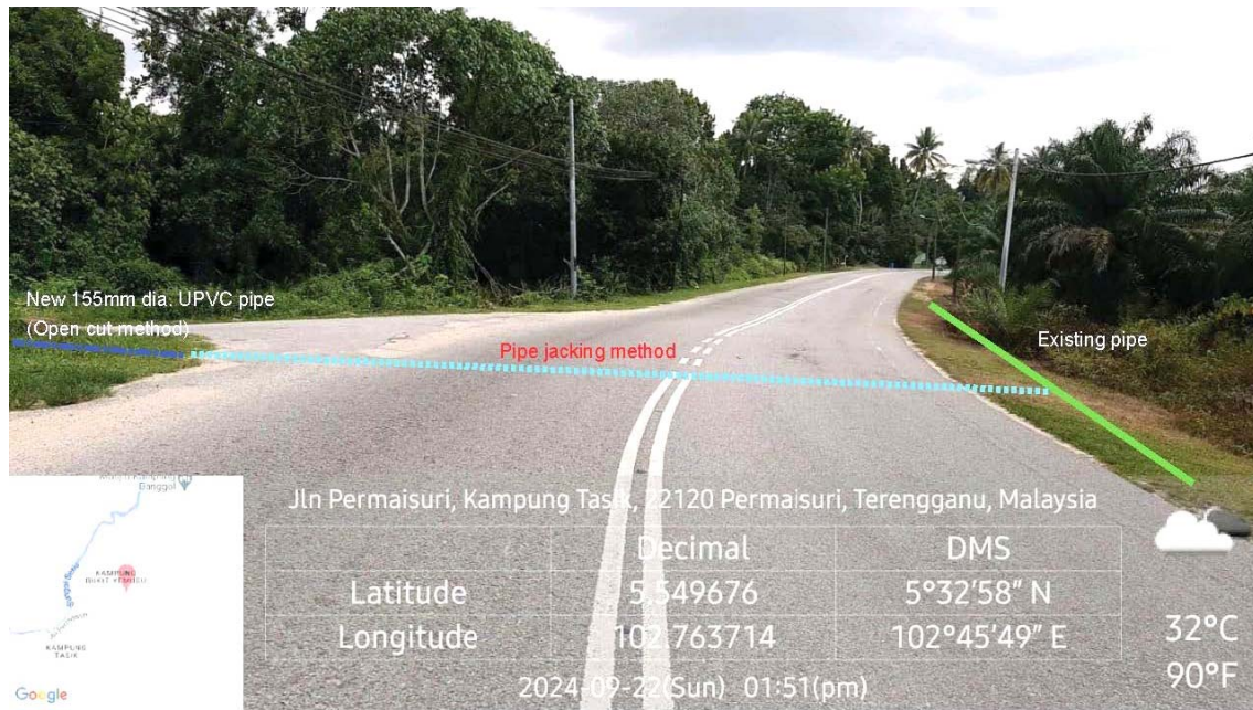
GAMBAR 1 : Kawasan cadangan laluan paip baru dan sambungan ke paip sedia ada.