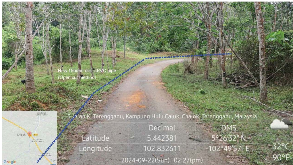
GAMBAR 3 : Kawasan cadangan laluan paip baru pada laluan tepi jalan.