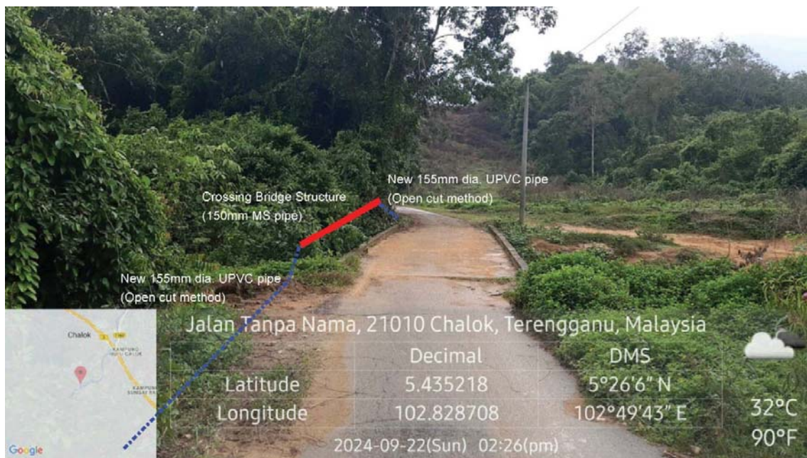
GAMBAR 2 : Kawasan cadangan laluan paip baru pada laluan tepi jalan dan 'Crossing bridge construction'.