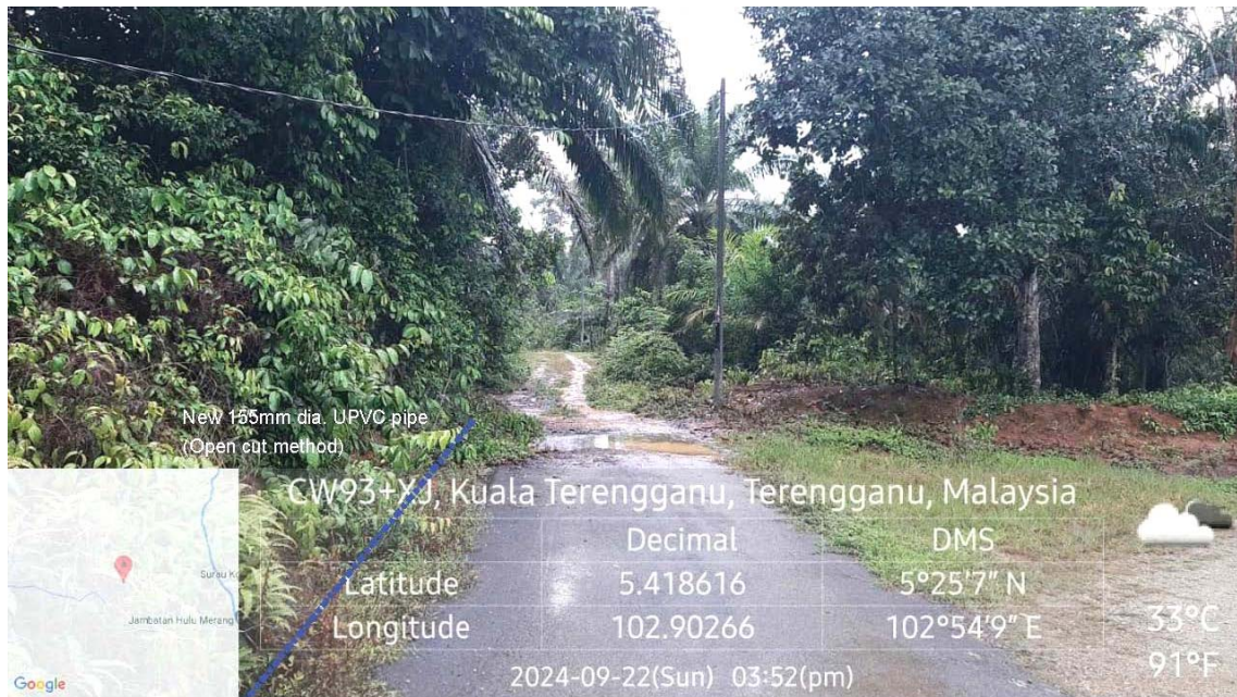
GAMBAR 6 : Kawasan cadangan laluan paip baru pada laluan tepi jalan.