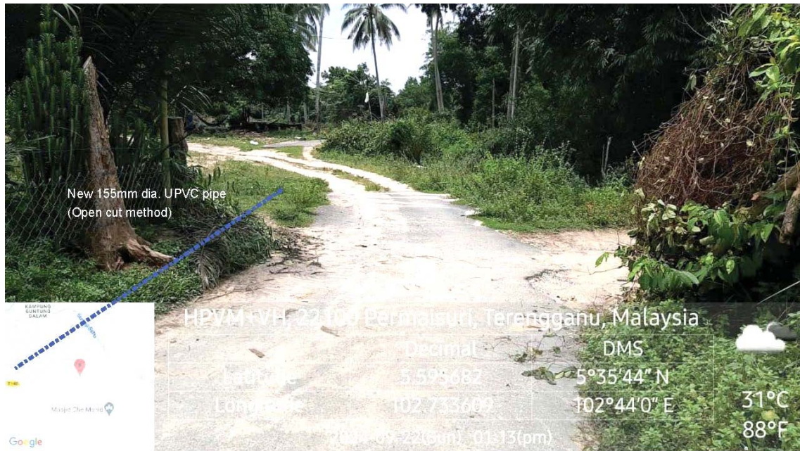
GAMBAR 2 : Kawasan cadangan laluan paip baru pada laluan tepi jalan.