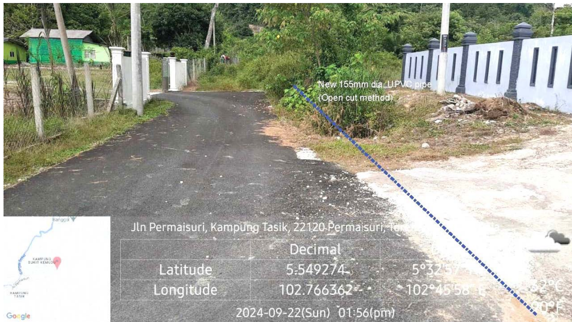
GAMBAR 4 : Kawasan cadangan laluan paip baru pada laluan tepi jalan.