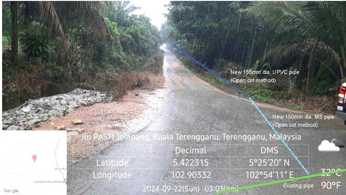
GAMBAR 1 : Kawasan cadangan laluan paip baru dan sambungan ke paip sedia ada.