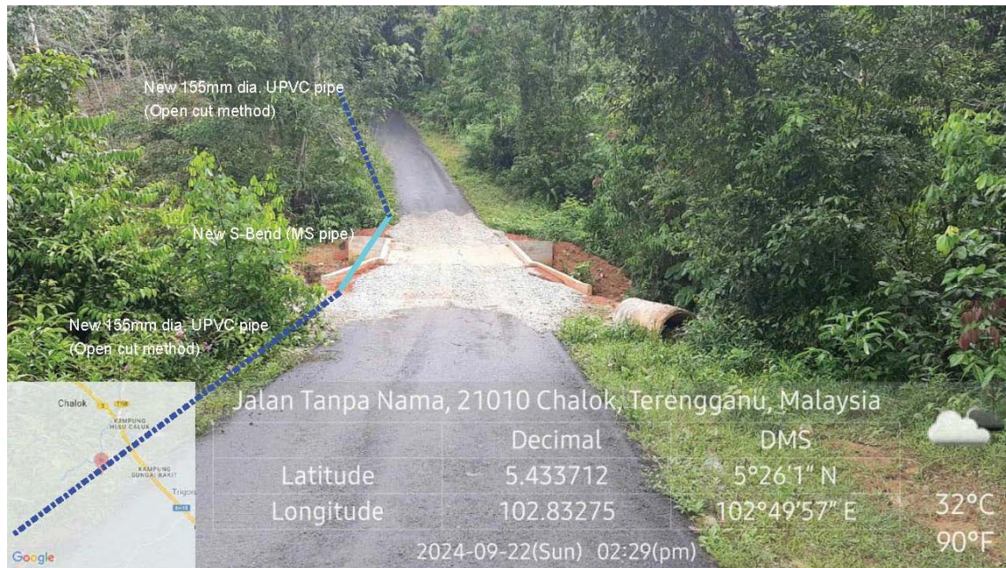
GAMBAR 5 : Kawasan cadangan laluan paip baru pada laluan tepi jalan.