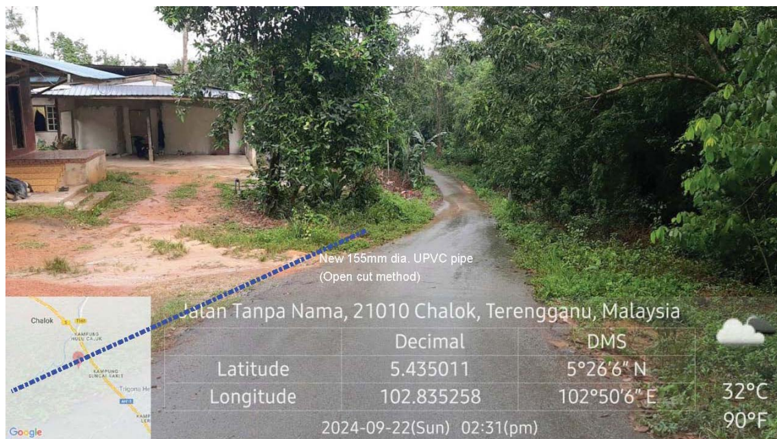
GAMBAR 6 : Kawasan cadangan laluan paip baru pada laluan tepi jalan.