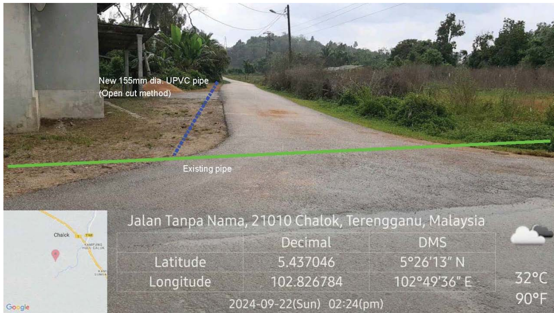
GAMBAR 1 : Kawasan cadangan laluan paip baru dan sambungan ke paip sedia ada.