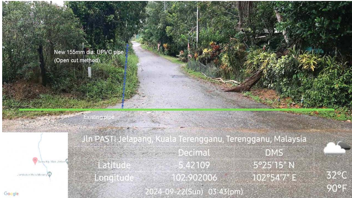
GAMBAR 5 : Kawasan cadangan laluan paip baru dan sambungan ke paip sedia ada.