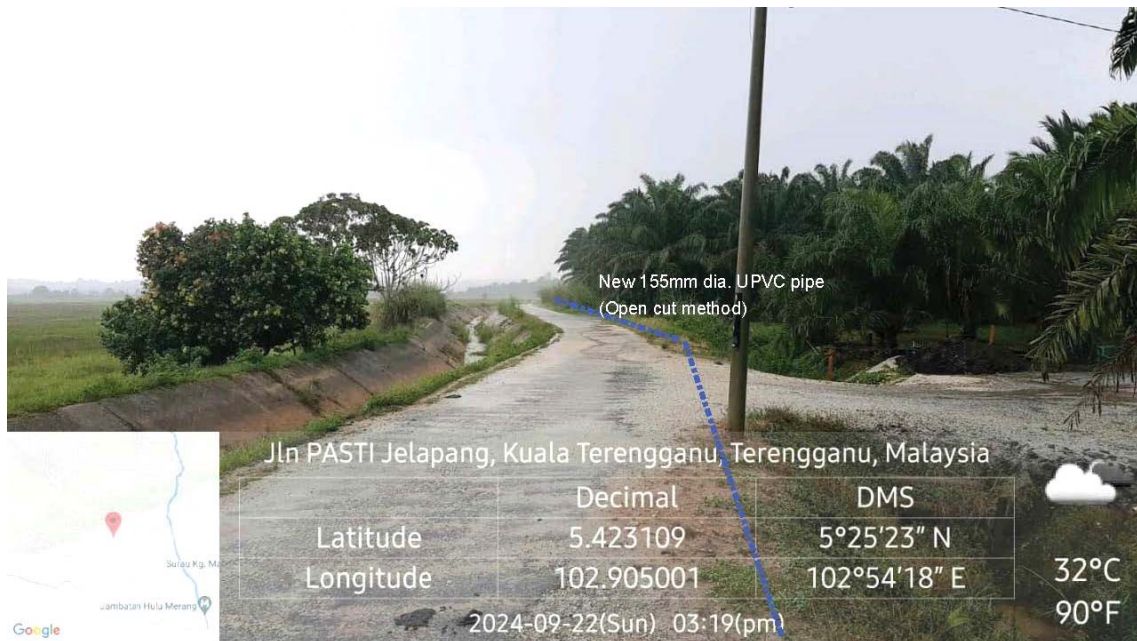
GAMBAR 2 : Kawasan cadangan laluan paip baru pada laluan tepi jalan.