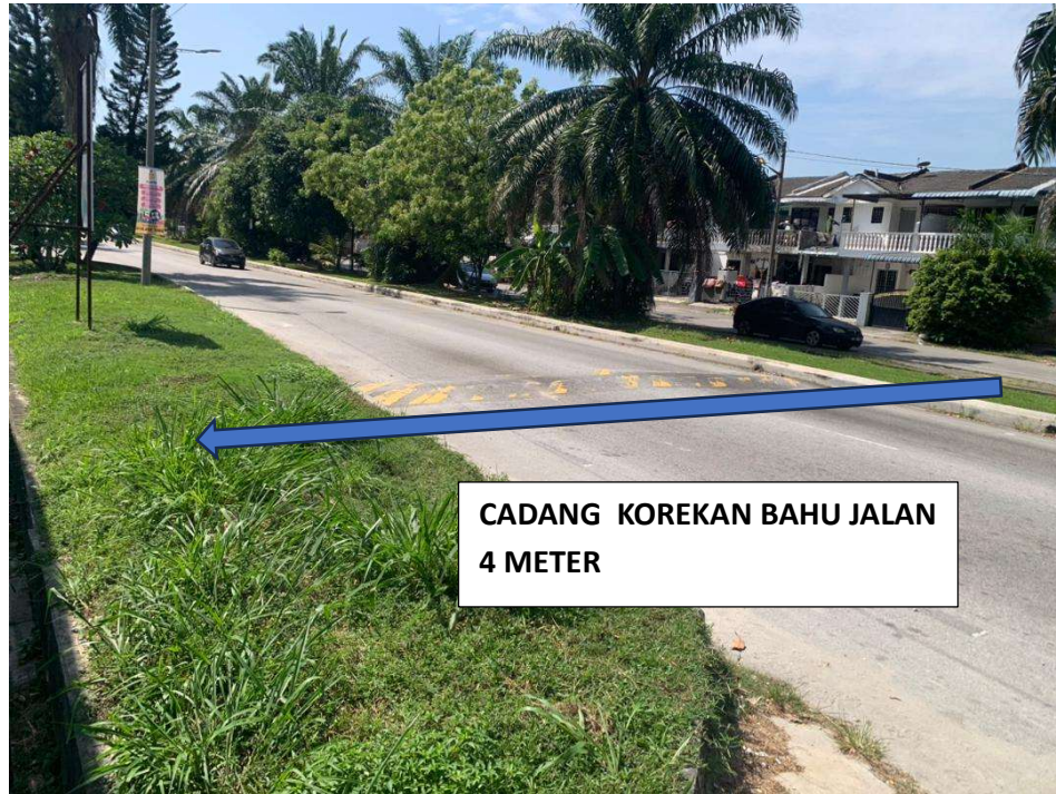
GAMBAR RAJAH 1 : KAWASAN KERJA YANG MELIBATKAN PEMOTONGAN JALAN DAN BAHU JALAN SISI KANAN