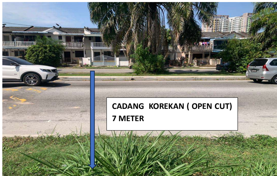
GAMBAR RAJAH 2 : KAWASAN KERJA YANG MELIBATKAN POTONGAN JALAN DAN BAHU JALAN SISI HADAPAN