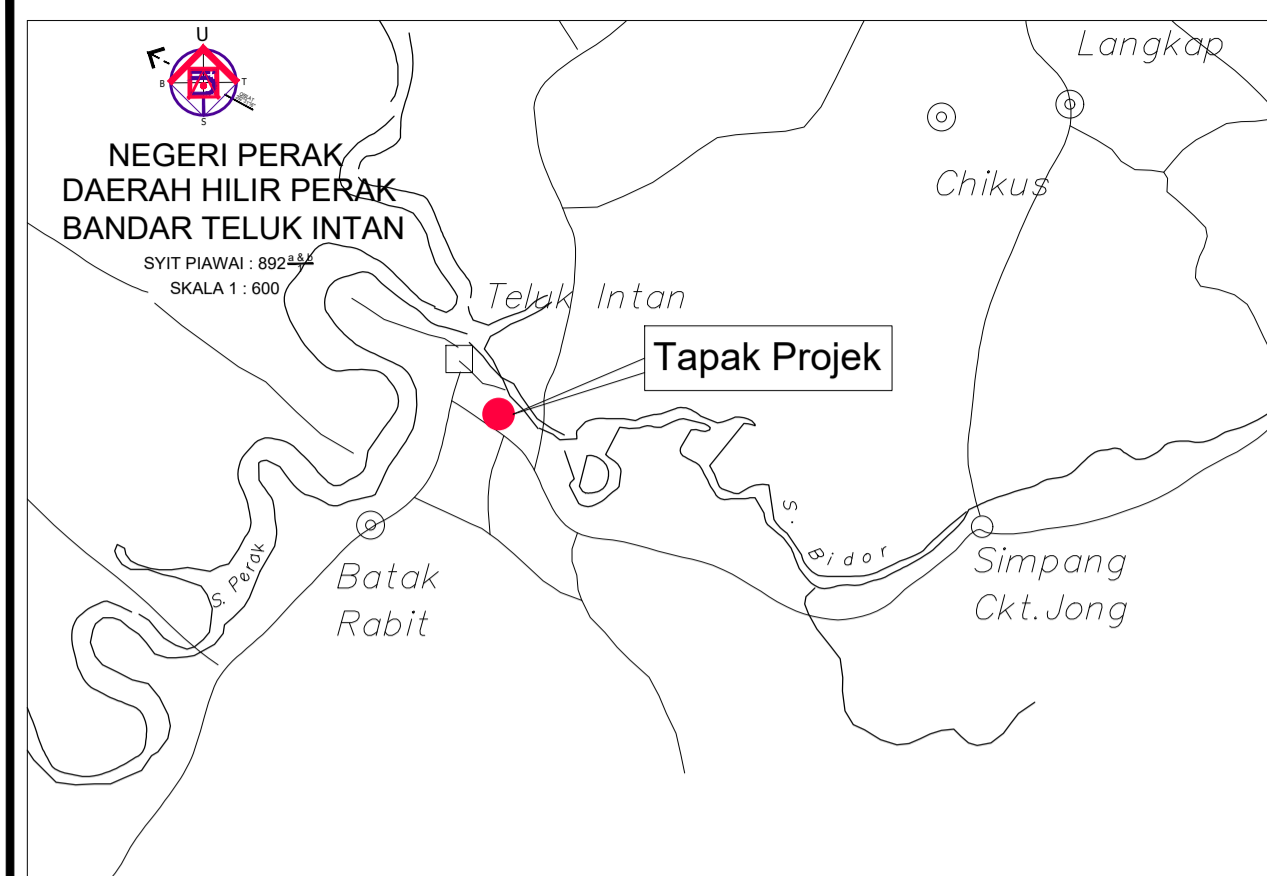
1 PELAN KUNCI 1 : 50 000