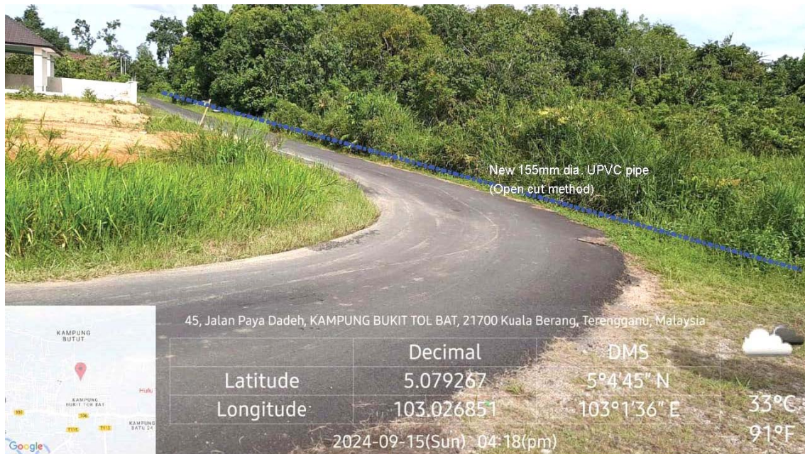
GAMBAR 4 : Kawasan cadangan laluan paip baru di tepi jalan.