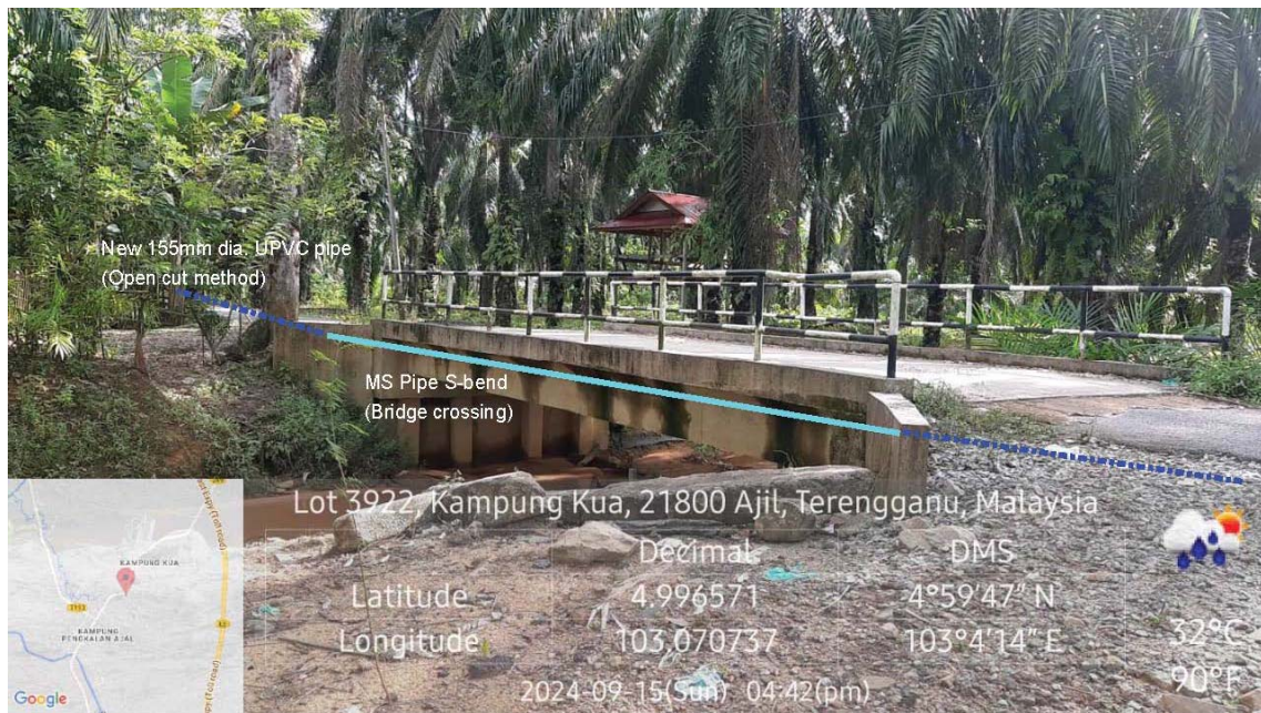
GAMBAR 2 : Kawasan cadangan laluan paip baru pada laluan tepi jalan.