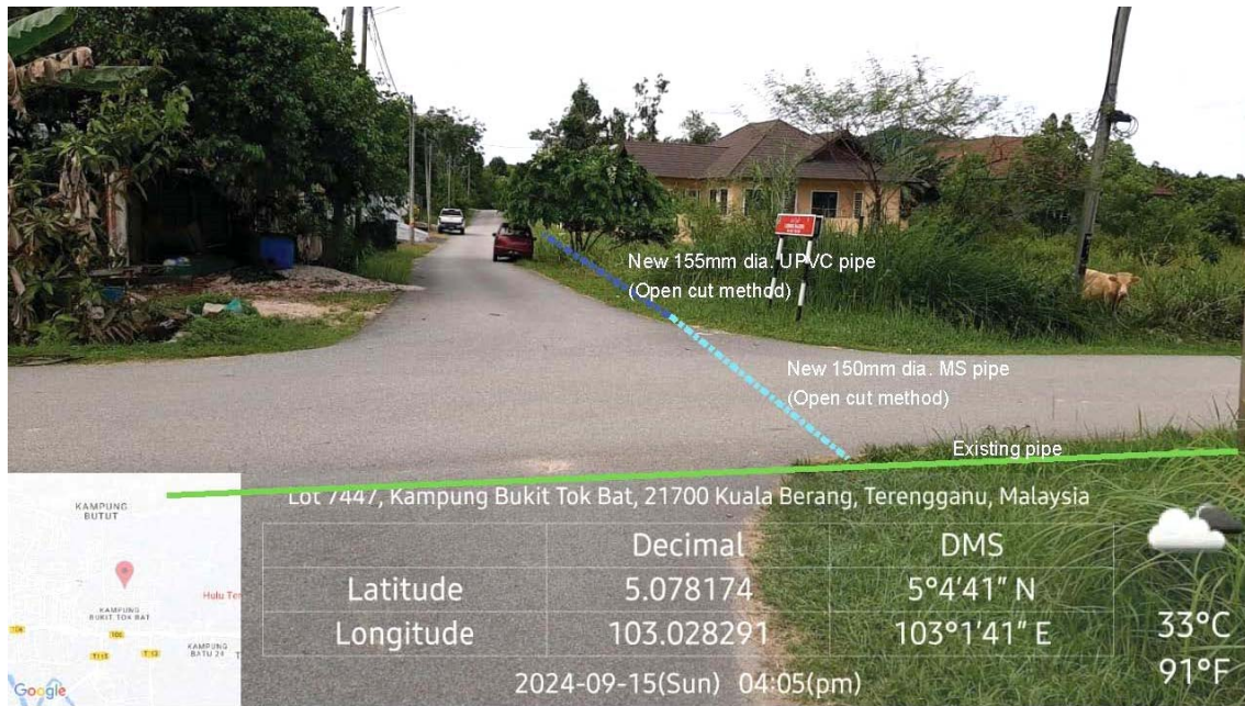
GAMBAR 3 : Kawasan cadangan laluan paip baru dan sambungan ke paip sedia ada.