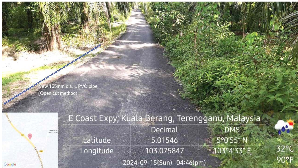
GAMBAR 3 : Kawasan cadangan laluan paip baru pada laluan tepi jalan.