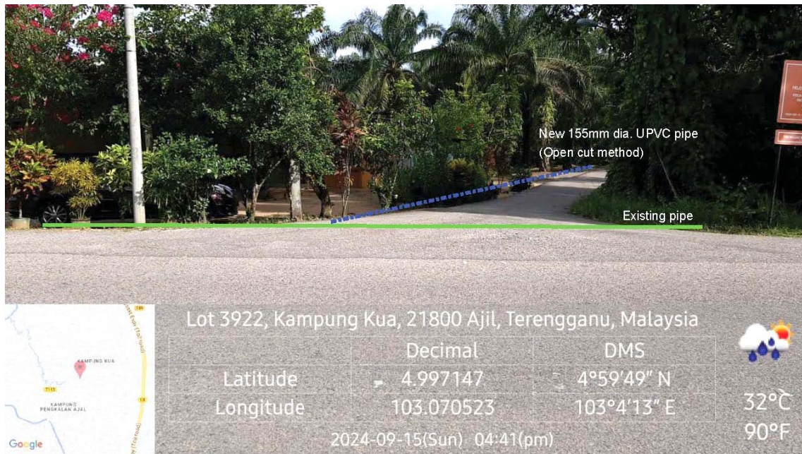
GAMBAR 1 : Kawasan cadangan laluan paip baru dan sambungan ke paip sedia ada.