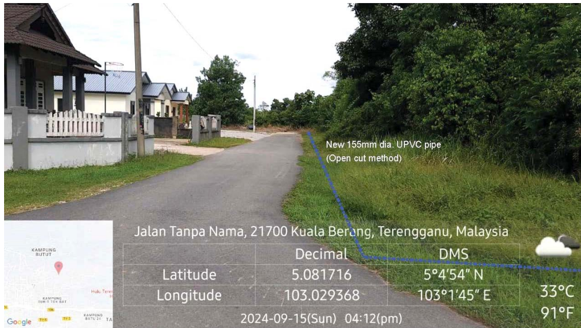
GAMBAR 5 : Kawasan cadangan laluan paip baru di tepi jalan.