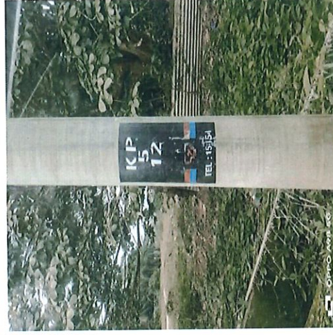
NOMBOR TIANG BERDEKATAN