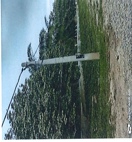
LAST POLE ABC 3X95MM S/ADA