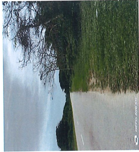
CADANGAN TIANG BARU