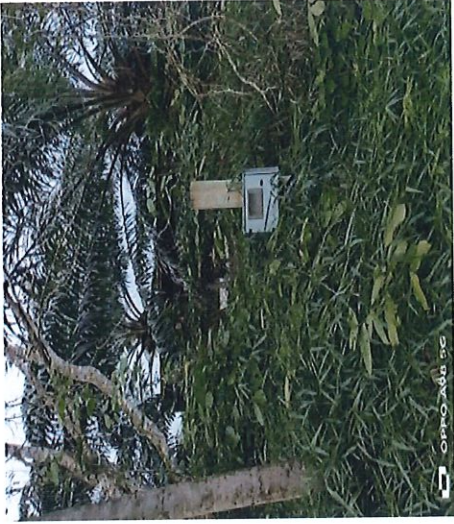
BOX METER PREMIS