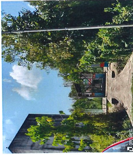
PUNCA BEKALAN-PE KG.PAPAN