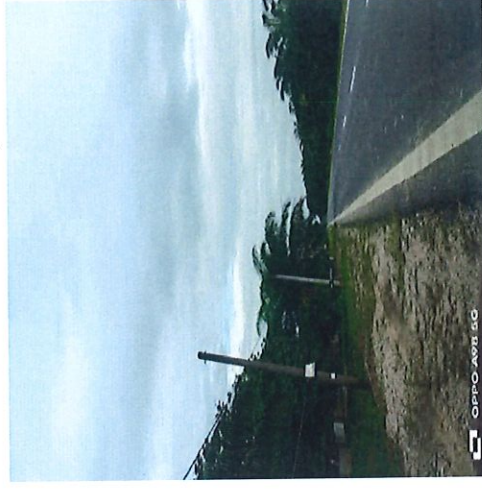
TIANG SEDIA ADA